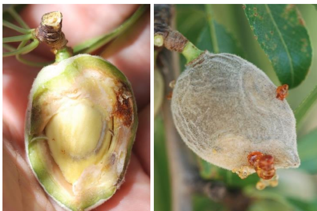
Danys a fruits d'ametller.

Els broquets inferiors de l'atomitzador s'han d'enfocar de manera que el tractament arribi també a les fulles caigudes al sòl.