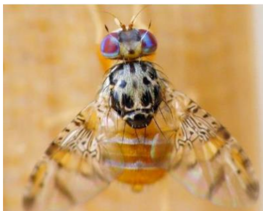
Exemplar adult de mosca de la fruita

Aquesta mosca afecta els cítrics i molts tipus de fruita (albercoc, figues, caquis, etc.). Els fruits són sensibles a partir del canvi de color perquè el color groc atreu a les femelles d'aquest insecte.