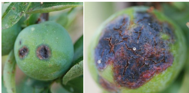
Danys a prunera

grups prop del nervi principal de la fulla i freqüentment en l'àpex.