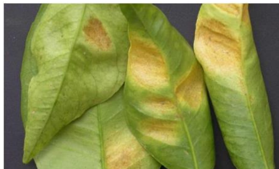
Símptomes al revers de les fulles provocats per Tetranychus urticae

Pel control de l'aranya roja el llindar de tractament s'estableix en un 10% de fulles de la darrera brotada amb presència de l'àcar o 2% de fruits amb la seva presència al final de l'estiu. El seguiment es fa entre maig i octubre, observant 2 fulles/arbre en 50 arbres. Les matèries actives autoritzades pel seu control són les que es citen a continuació: