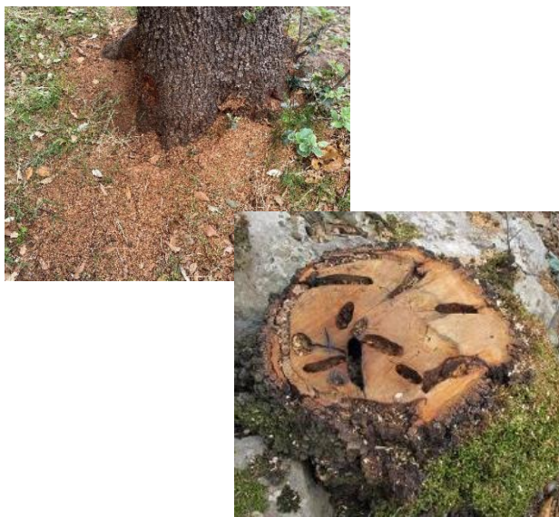
Galeries provocades per l'alimentació de les larves i serradís a la base del tronc.

Mentre la larva fa les galeries i just abans de sortir l'insecte adult, produeix un serradís del mateix color que el de la fusta del tronc i de l'escorça, que queda en petits munts a la soca de l'arbre. Aquest, juntament amb els forats de sortida dels adults a l'escorça del tronc, és un dels indicis més clars per detectar la presència de l'insecte.