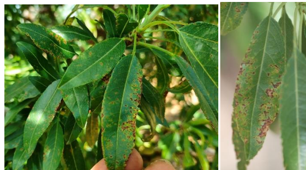
Simptomatologia a fulles d'ametller.

Degut a que els símptomes es poden confondre amb altres malalties és necessària la confirmació amb el Laboratori de Sanitat Vegetal així com també és necessària la seva prevenció i control per a reduir l'impacte a les nostres plantacions.