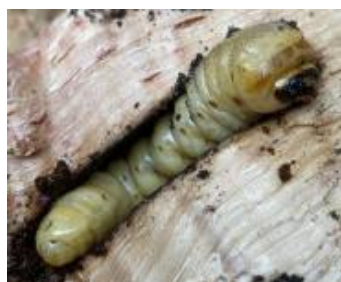
Larva alimentant-se a l'interior d'una galeria.

Les larves són de color blanc groguenc, amb el cap de color negre i poden arribar als 85 mm de longitud i als 16 mm d'amplada al final del desenvolupament. Tenen una forma cilíndrica, amb uns segments corporals molt marcats. En acabar el període larvari, es transforma en pupa i va enfosquit-se durant la metamorfosi fins a arribar a tenir el color definitiu, característic dels individus adults.