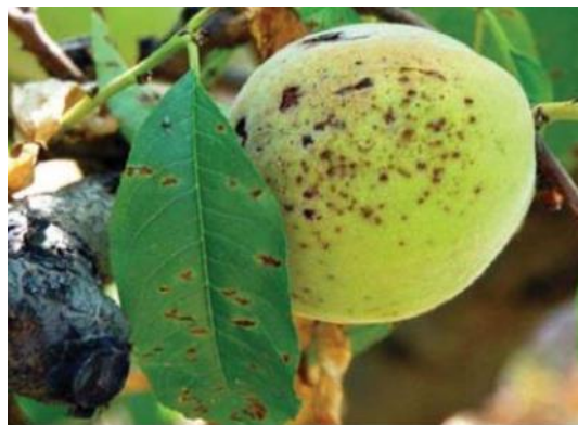
Símptomes de la taca bacteriana a melicotoner.

Xanthomonas arboricola pv. pruni és una malaltia provocada per un bacteri que provoca taques en els fruits, la qual cosa deprecia la collita, però també ocasiona una forta defoliació amb la debilitació consegüent de l'arbre i la pèrdua progressiva de producció amb el transcurs dels anys.