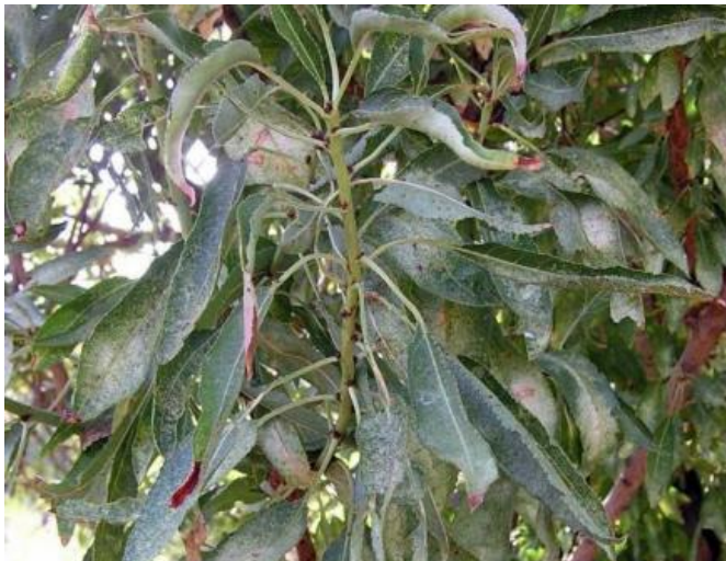
Danys provocats a fulles per la xinxà de l'ametller

Des del mes de juny es comencen a desenvolupar sobre les fulles les colònies de la primera generació.