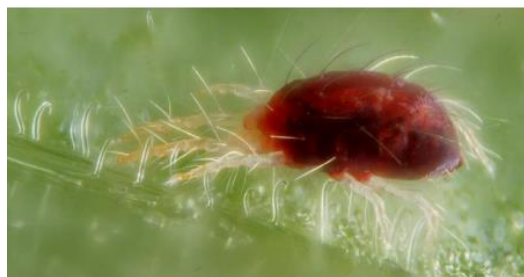
Adult de Tetranychus urticae

És un àcar molt polífaq tant en cultius a l'aire lliure com a hivernacles. Dels cultius de cítrics, els més sensibles al seu atac són el clementiner i la llimonera.