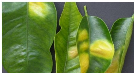
Símptomes a l'anvers de les fulles provocats per Tetranychus urticae

Les zones de les fulles on es desenvolupen les colònies es fan còncaves i tornen grogues per l'anvers, amb una coloració de rovell pel revers. També es produeix una defoliació considerable.