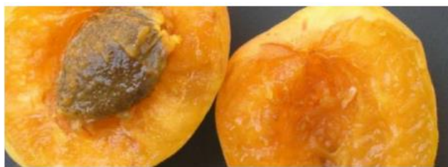
Larva de mosca de la fruita alimentant-se de polpa d'albercoc

Com a mesures fitosanitàries complementàries s'estableixen els tractaments químics i la captura massiva (almenys 50 trampes/ha, que s'han de col·locar a fruiters al maig, i a cítrics al setembre).