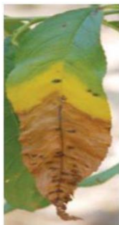
Simptomatologia a fulla de melicotoner.

En les fulles dels ametllers apareixen taques obscures i poligonals similars a les que apareixen als melicotoners, produint crivellat, però la defoliació no és tan forta ni tampoc presenten fulles tricolor.