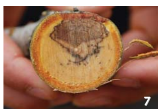
1) i 2) Fusicoccum en ametler, 3) Monilia en albercoquer, 4), 5), 6) i 7) Fongs de fusta en ametler