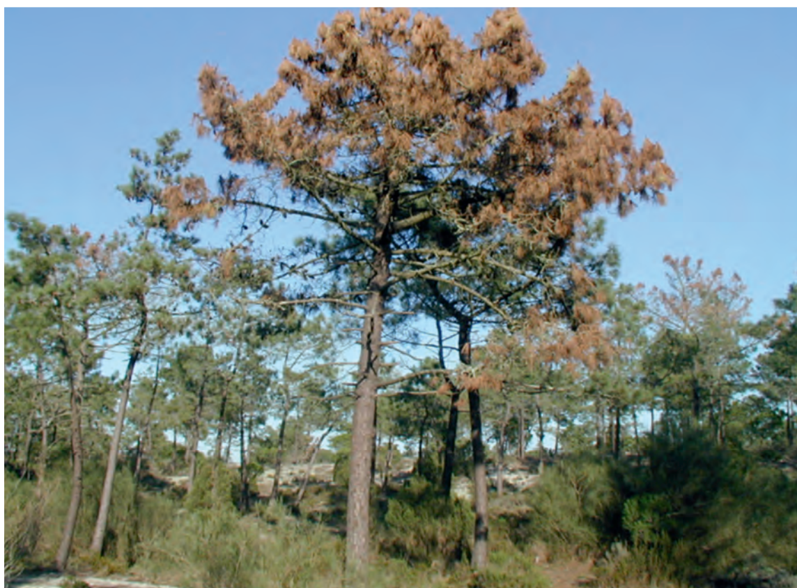
Foto 1.- Pinar afectado por “Pine Wilt Disease”, enfermedad del nematodo del pino.