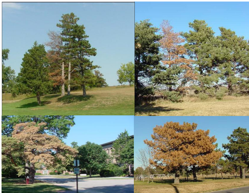
Simptomatologia de la seca del pi en diversos paisatges. (Pla Nacional de Contingència, Ministeri de Medi Ambient i Medi Rural i Marí, 2008)

l'arbre fins que finalment mor. Aquests símptomes apareixen generalment entre els mesos de agost i desembre, i es denomina "decaïment sobtat o seca del pi".