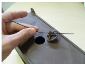
Feu passar el cordó pel forat del tap.