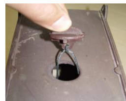
Col·locau el tap dins la carcassa.