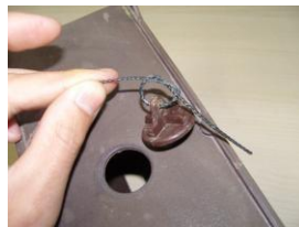
Feu un nus al cordó.