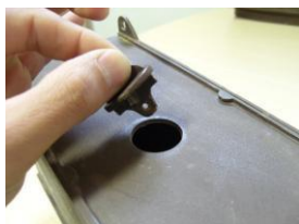
Retirau el tap de la carcassa.