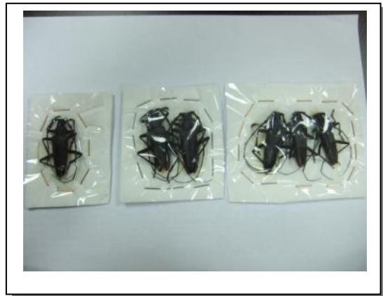
24. Individuos empaquetados