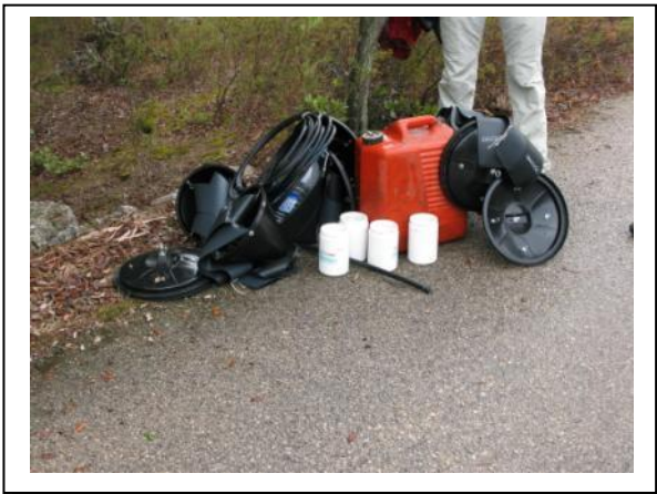
11. Material de campo