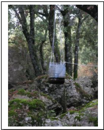
19. Trampa tipo garrafón versión 1