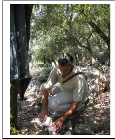
20. Recogida botes