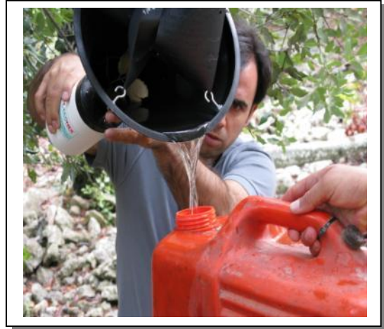
22. Recuperación líquido