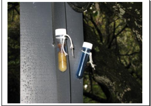
16. Botes efluyentes