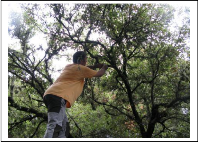
9. Recogida datos sensor temperatura