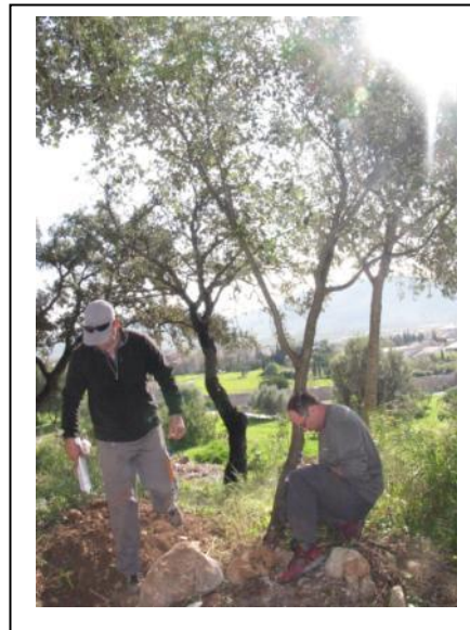
2. Inspección encinas