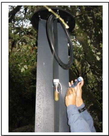
15. Colocación botes efluyentes