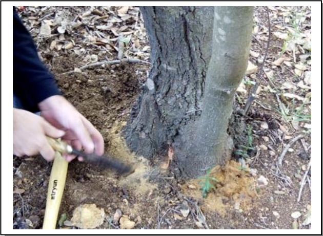
5. Detalle prospección base