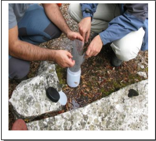
21. Filtrado muestras