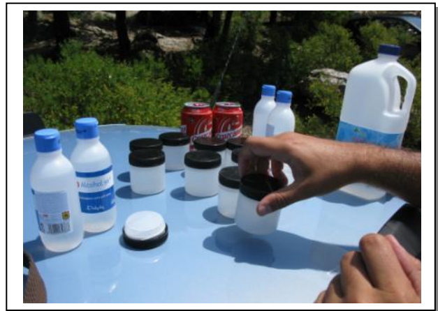
12. Material botes recogida muestras