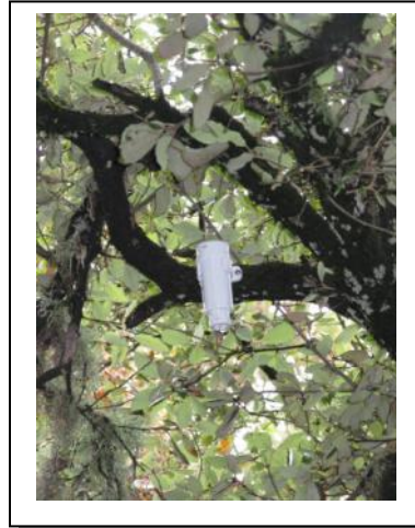
10. Sensor temperatura en árbol