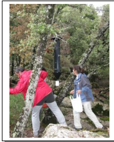
14. Trampa recién instalada