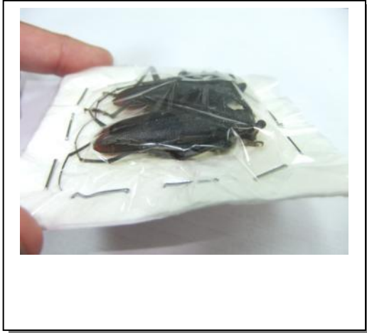
25. Vista lateral empaquetado