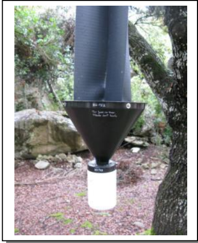
17. Detalle trampa codificada