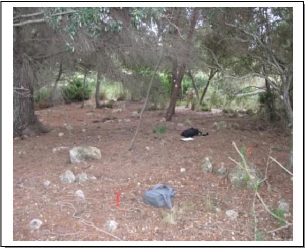
7. Centro de parcela