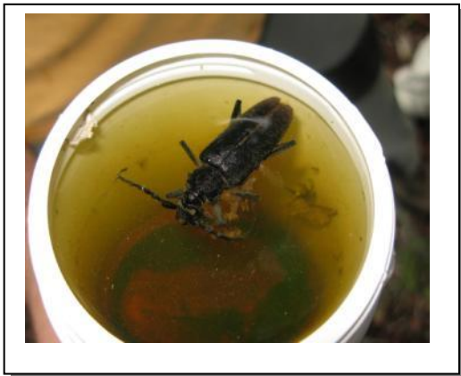
23. Cerambyx captura en trampa