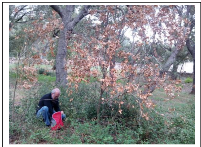
4. Prospección base