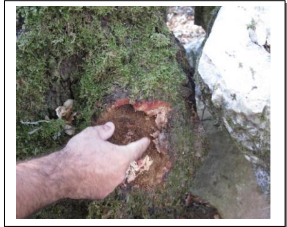
6. Confirmación existencia galerías