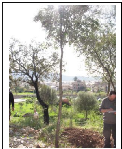
3. Toma de datos