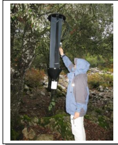
18. Comprobación efluyentes