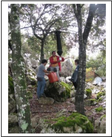
13. Equipo colocando trampa