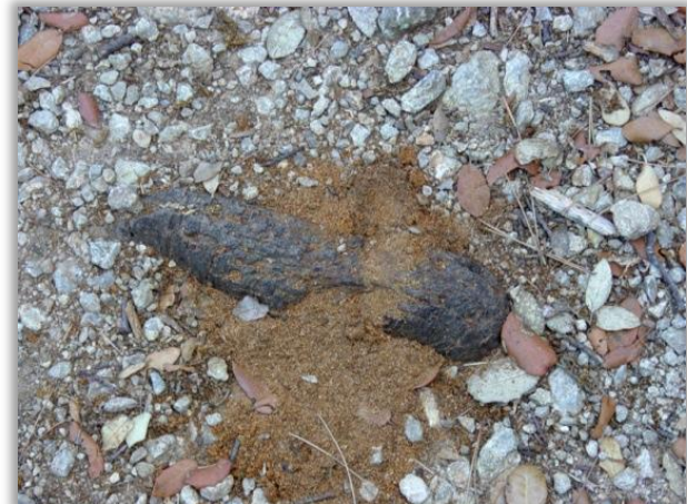
SERRÍN EN RAICES