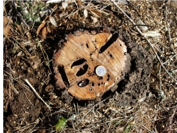
AGUJEREADAS EN TOCÓN