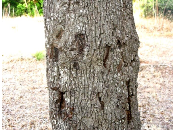
ORIFICIOS EN TRONCO