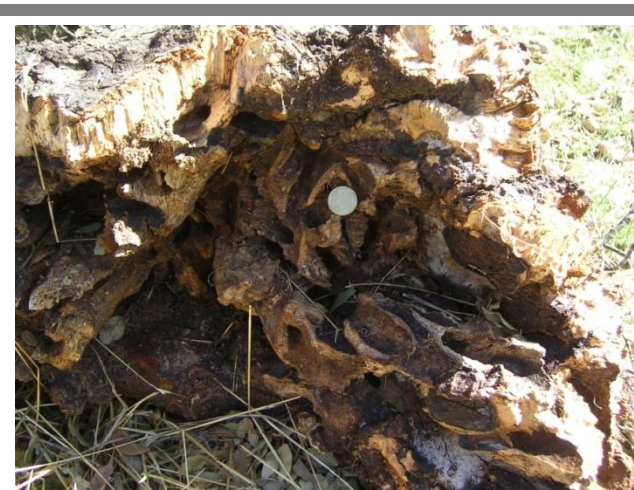
GALERÍAS EN BASE