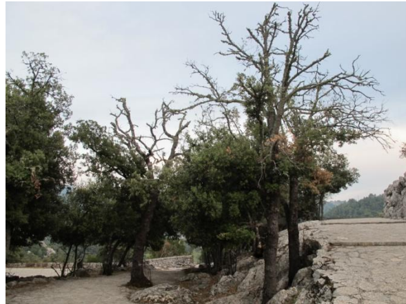
BAJADA DE COPA