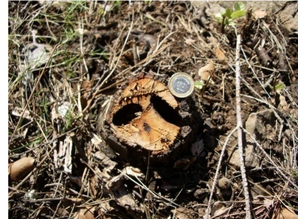
AGUJEREADAS PEQUEÑAS ENCINAS