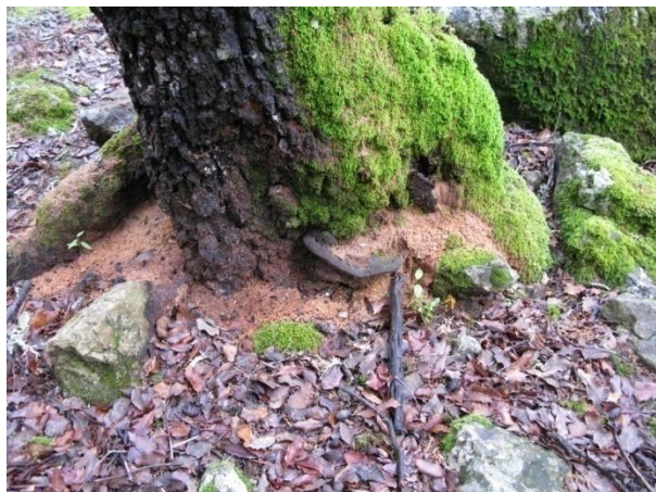
MUSGO Y HONGO