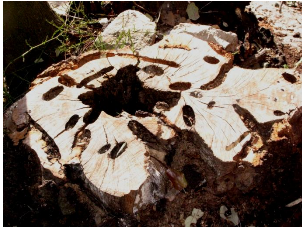
AGUJEREADAS POR TODO