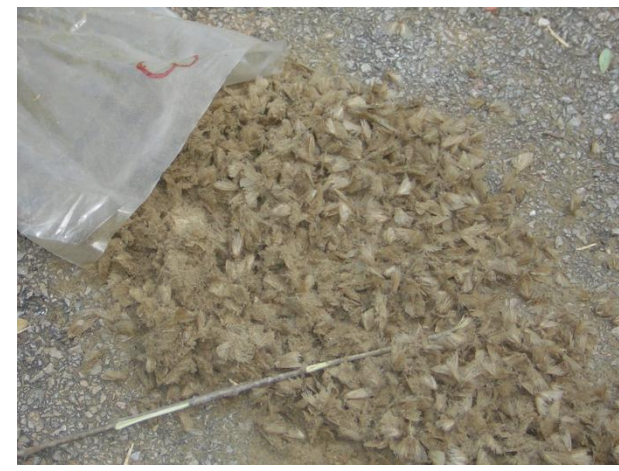
Imagos Lymantria dispar