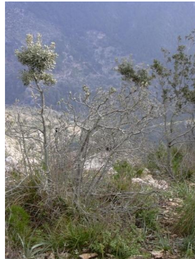
RAMONEADAS Y COMIDAS