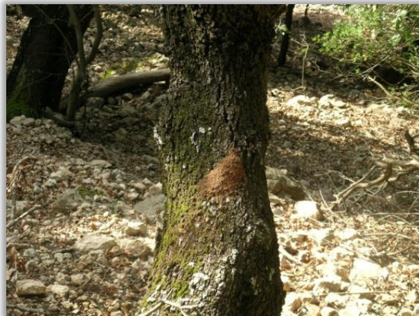
SERRÍN EN TRONCO