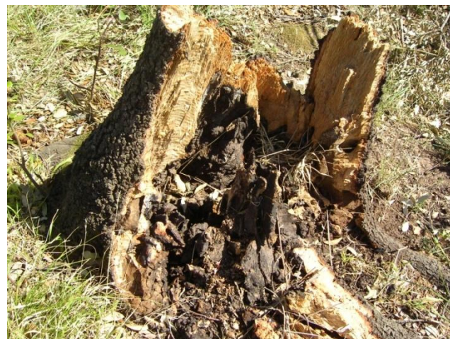
GALERÍAS Y PUDRICIÓN