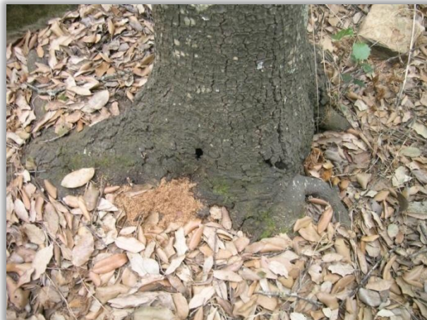
SERRÍN EN BASE