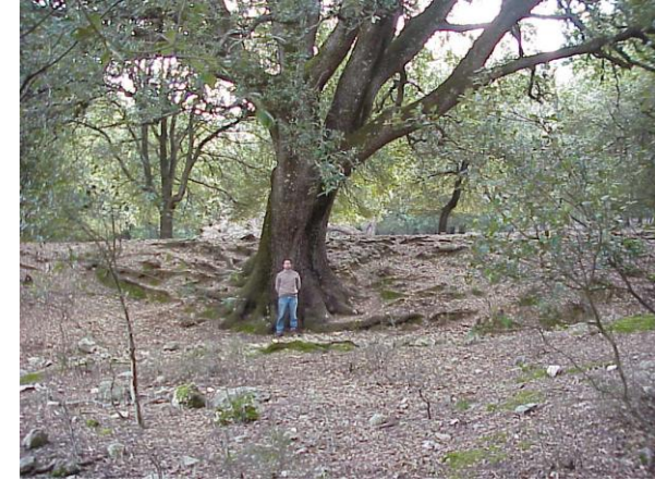
GRANDES Y VIEJAS