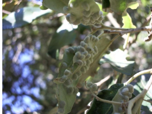
Con Dryomyia lichtensteini