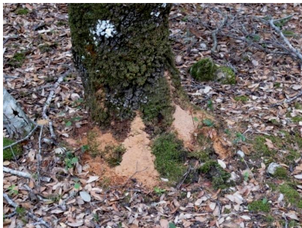
SERRÍN EN BASE