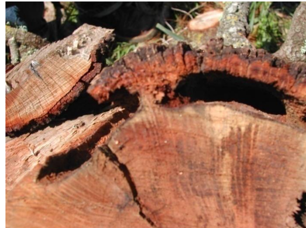
GALERIAS EN CAMBIUM