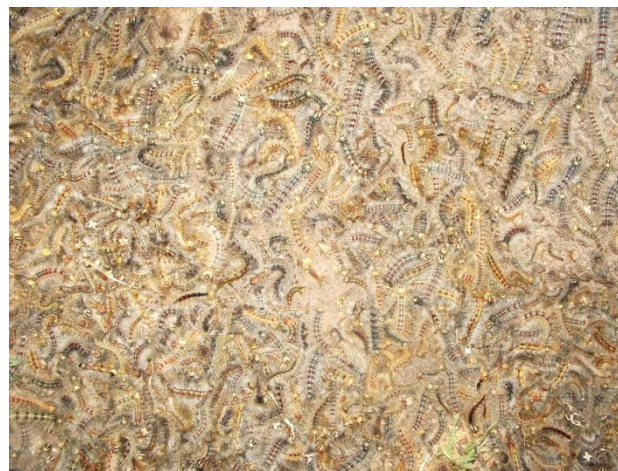
Orugas Lymantria dispar