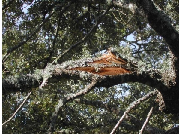
ROTAS POR NIEVE