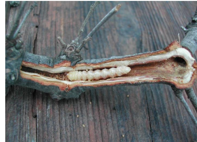
GALERIAS EN RAMAS PEQUEÑAS