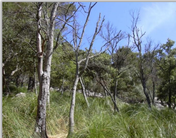
MUERTAS POR HONGOS