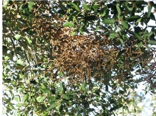
Con Taphrina kruchii