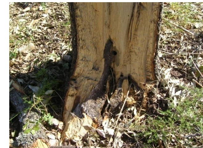
GALERÍA EN BASE