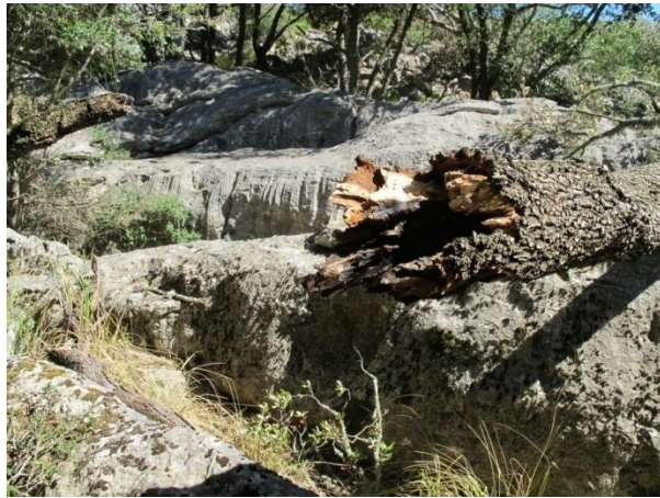
AGUJEREADAS, PODRIDAS, CAIDAS