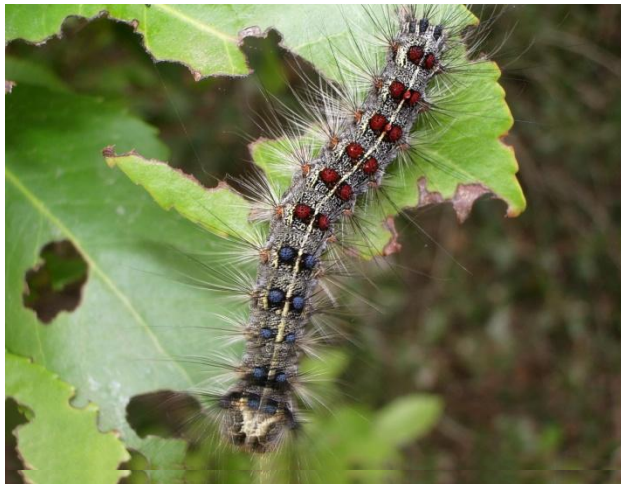
Oruga Lymantria dispar