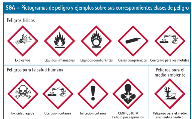
Reglament (CE) nº 1272/2008