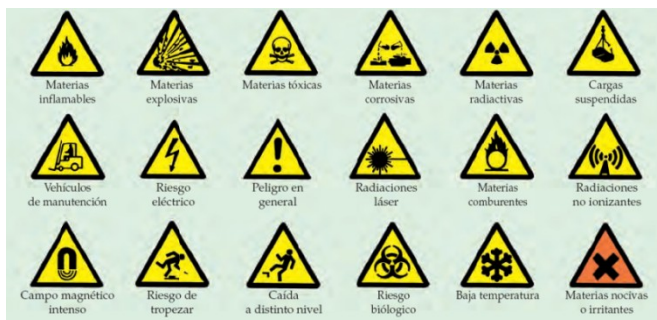
Reial Decret 363/1995 i Reial Decret 255/2003

Ha hagut una actualització dels pictogrames, aquí podeu veure els antics i els nous que conviuran fins dia 1 de juny de 2015.