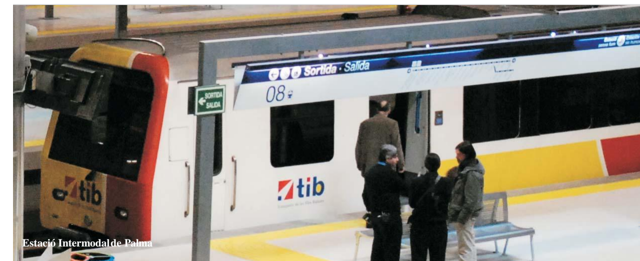
Estació Intermodal de Palma