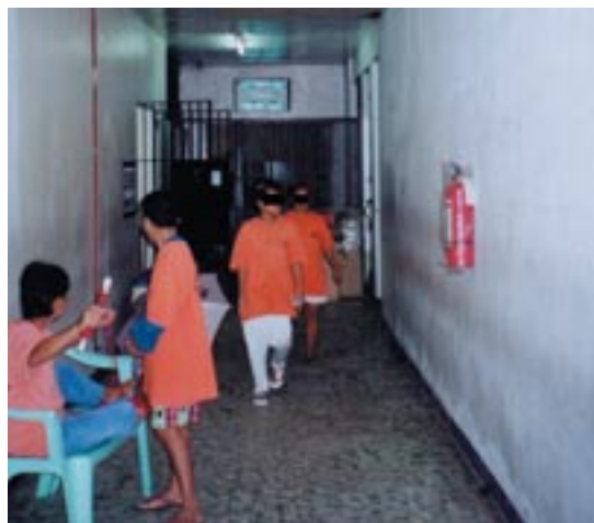
Presons de Filipines