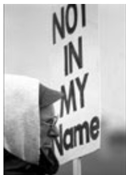
Manifestació de protesta a Colòmbia davant el consolat de Nigèria

De fet, la pena de mort habitualment consistia en una tortura més o menys perllongada que no s'acabava fins que el condemnat moria.