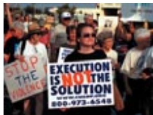
Manifestants, el dia abans de l'execució

Tanmateix, plantejar la reintroducció de la pena de mort en el Codi Militar per a delictes comesos en temps de guerra, tot i no violar l'article 15 de la Constitució, aniria contra el Segon Protocol del Pacte Internacional de Drets Civils i Polítics, signat per Espanya. Aquest compromís dificultaria fer marxa enrere, però, malauradament, els estats no sempre respecten tots els tractats internacionals que signen.