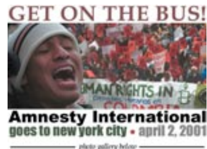
Nova York pels drets humans a Colòmbia