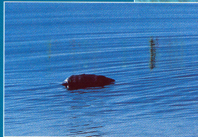
Tortuga marina assolellant-se.

Les altres dues espècies són més difícils d'observar: la tortuga verda (Chelonia