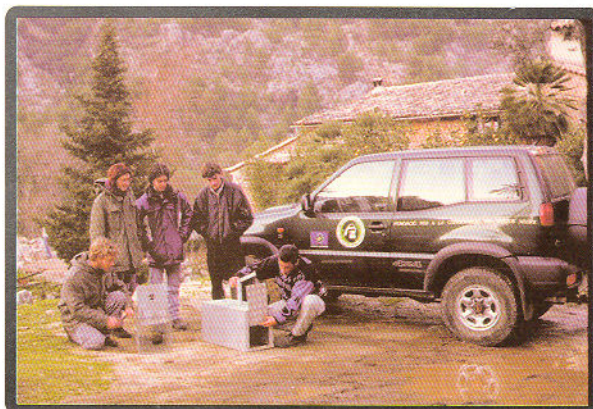
La colaboración de voluntarios es fundamental para la Campaña Gato Asilvestrado.