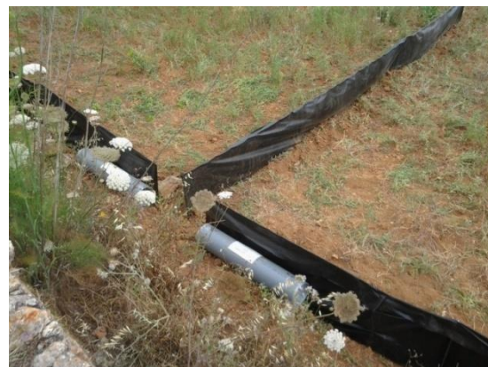
Fig. 2: Trampes de doble embut amb utilització de malles de desviament.