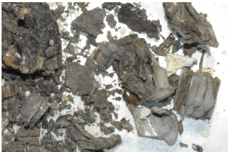
Fig. 6 :: Excrement d' Hemorrhois hippocrepis contenint escames caudals i ventrals de lacèrtid.