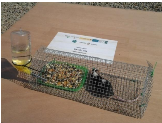
Fig. 1: Gàbia amb el ratolí viu, que es col·loca a l'interior de la trampa.

Degut a la mortalitat massiva dels ratolins, després de la primera setmana es va deixar d'utilitzar l'animal viu com a esquer en aquest tipus de trampa, tanmateix es va mantenir el cadàver per provar-lo com a mètode d'esquer.