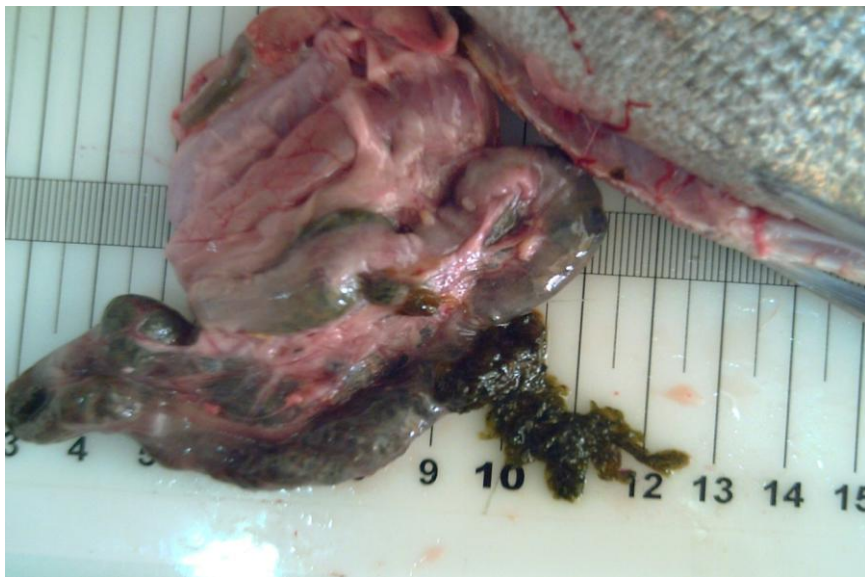
Fig. 2. Detall del contingut estomacal d'un exemplar de Spondyliosoma cantharus capturat a la Badia de Palma.