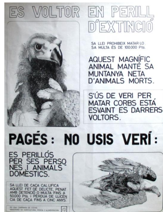
Fig. 1. Pòster editat l'any 1972 destinat a la conservació del voltor negre ( Aegypius monachus ).

Posteriorment, el 1982, l'Administració competent en la conservació, que en aquella època era l'Institut per a la Conservació de la Natura (ICONA), va assumir la realització d'aquests recomptes que es feien amb la participació de personal propi i voluntaris, molts d'ells participants en els anteriors censos realitzats per la Societat d'Història Natural i pel GOB. Aquest any es va determinar que hi havia entre 22 i 24 exemplars, un mínim de 7 colles de les quals 4 varen efectuar posta i només 2 polls varen volar. Els censos es repetiren amb certa periodicitat. Per altra costat, l'ICONA va redactar en 1983 el Programa per a la Recuperació del Voltor Negre, que va ser el primer document destinat a organitzar la conservació d'aquest voltor i un document de referència per posteriors actuacions amb altres espècies. Els objectius generals d'aquest Programa eren augmentar l'èxit reproductor i disminuir la mortalitat d'aus adultes. Es varen començar a aplicar diverses mesures destinades a la recuperació de l'espècie reduint els factors que l'afecten negativament i implementant d'altres que l'afavoreixen. Altres actuacions dintre d'aquest programa varen ser la lluita contra l'ús del verí, campanyes de vigilància i