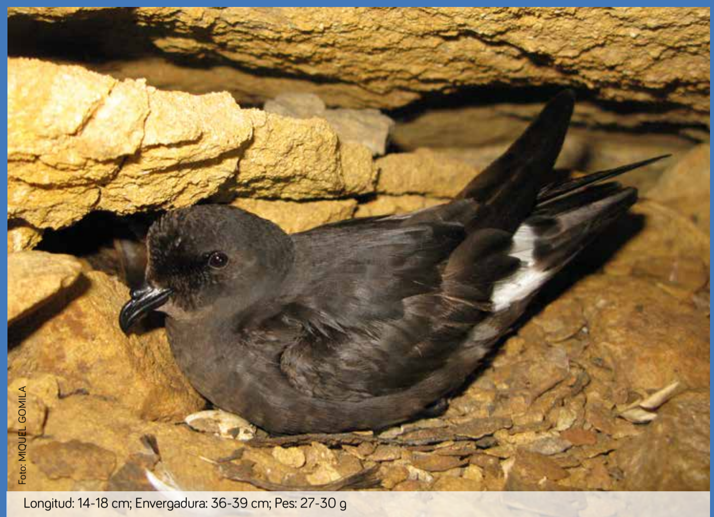
Longitud: 14-18 cm; Envergadura: 36-39 cm; Pes: 27-30 g