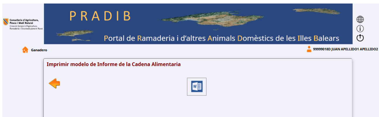
Imagen 4. Pantalla de Informe Cadena Alimentaria.

Al pulsar el botón de “Modelo de informe de la Cadena Alimentaria” se abre la siguiente pantalla: