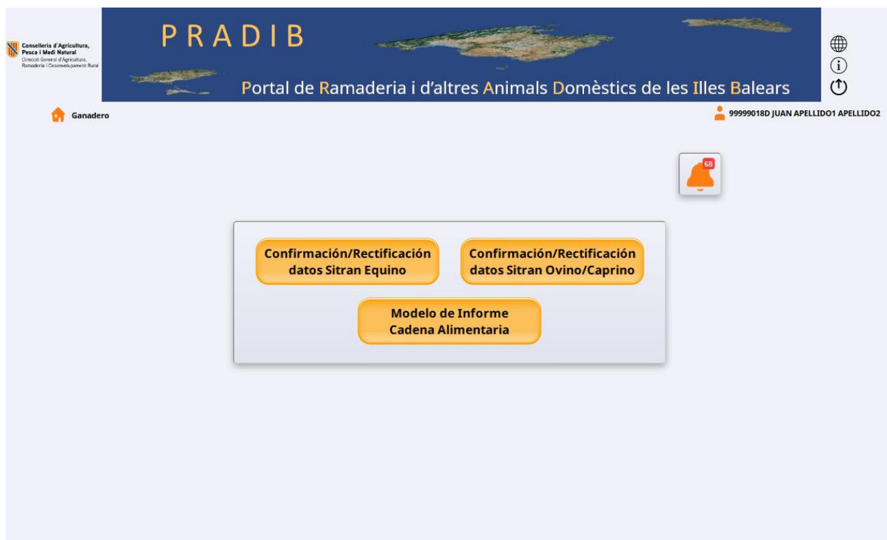
Imagen 2. Informes

Cuando se pulsa en la opción de “Informes”, aparece una pantalla con los informes disponibles