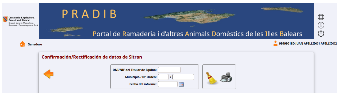
Imagen 3. Pantalla de Confirmación/Rectificación de datos de SITRAN Équido.

Al pulsar el botón de “Confirmación/Rectificación de datos SITRAN de Equino” se abre una pantalla en la que se pueden introducir distintos parámetros para seleccionar la explotación deseada: