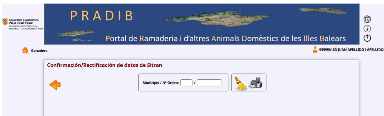
Imagen 4. Pantalla de Confirmación/Rectificación de datos de SITRAN Équido.

Al pulsar el botón de “Confirmación/Rectificación de datos SITRAN de Ovino/caprino” se abre la siguiente pantalla: