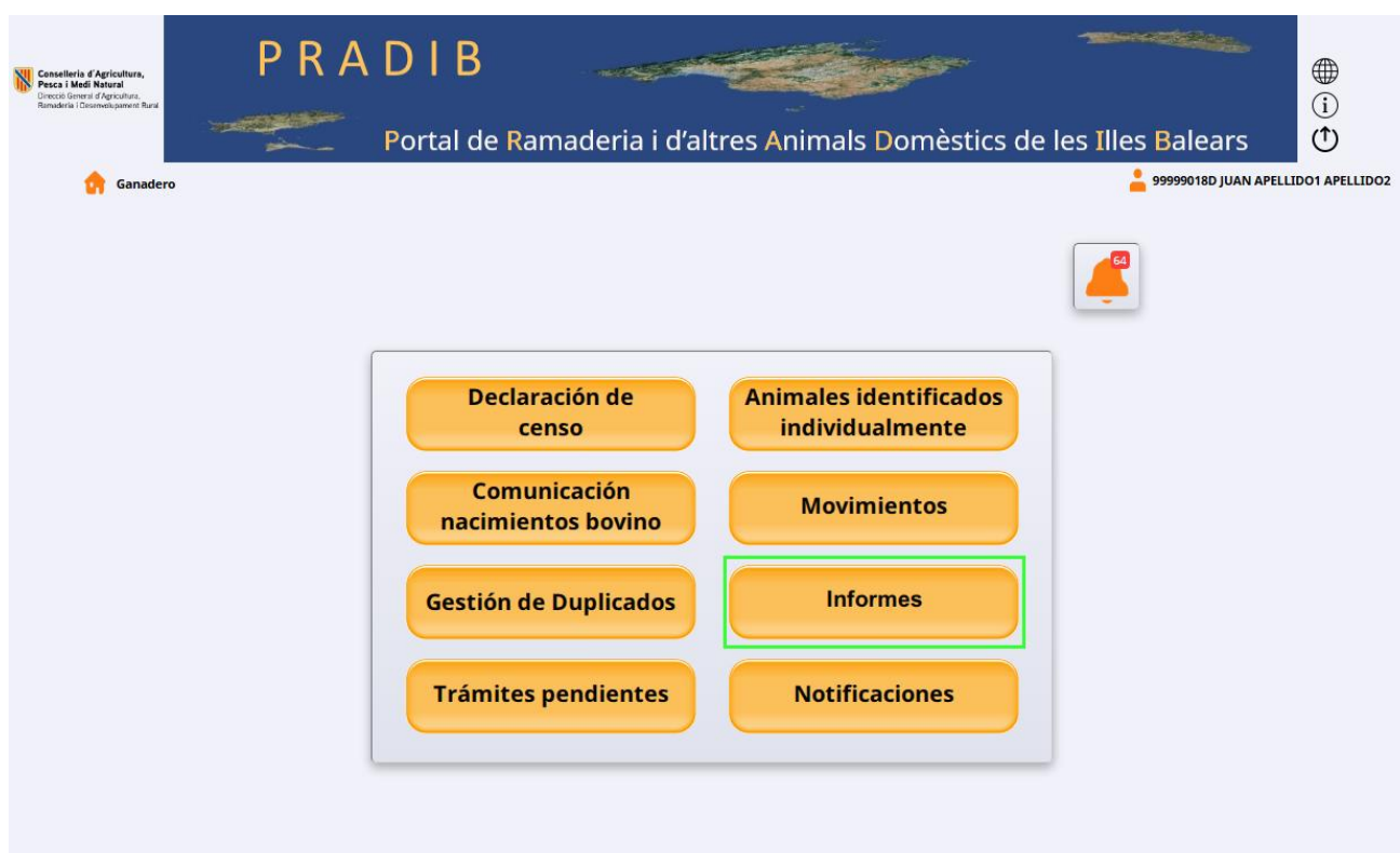
Imagen 1. Pantalla de Inicio.

El acceso se realiza pulsando el botón “Informes” de la pantalla de inicio de la aplicación: