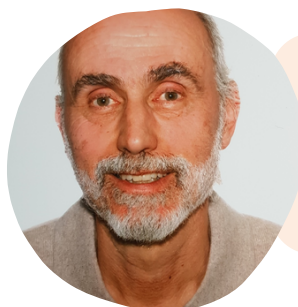
Vicenç de Febrer