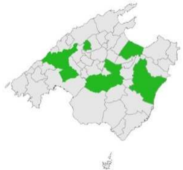
Municipis amb cita històrica de cultiu a Mallorca.