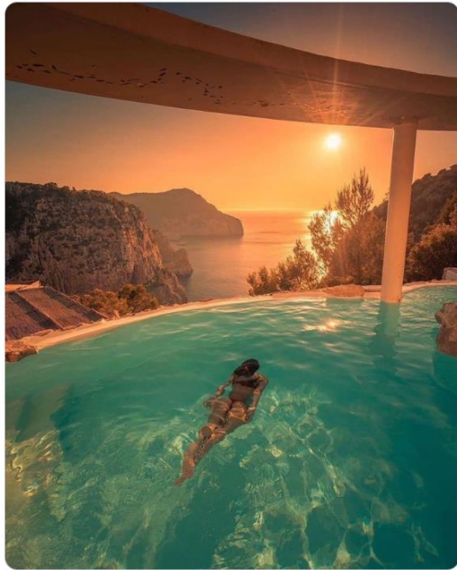
5:59 p. m. · 17 ene. 2024 · 82,1 mil Reproducciones