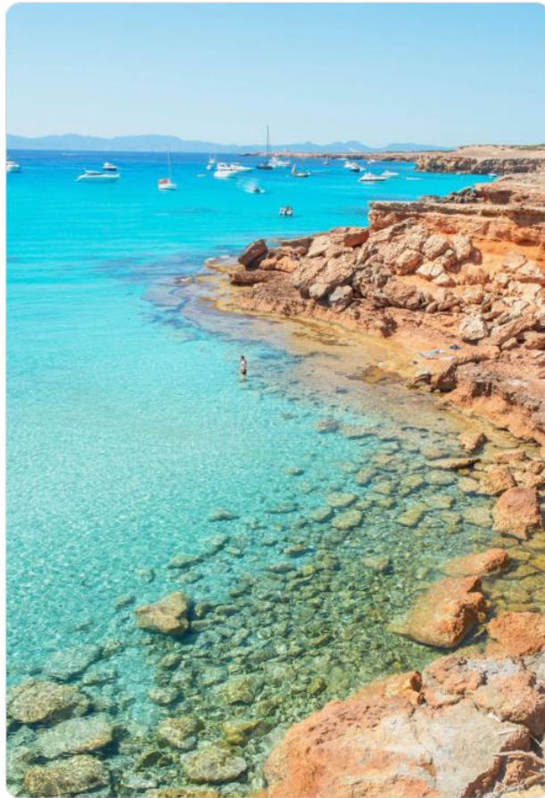
Formentera, Spain 🇪🇸

3:22 p. m. · 19 mar. 2024 · 1.745 Reproducciones