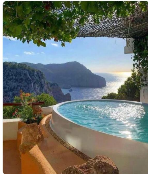
10:55 a. m. · 13 feb. 2024 · 26,3 mil Reproducciones