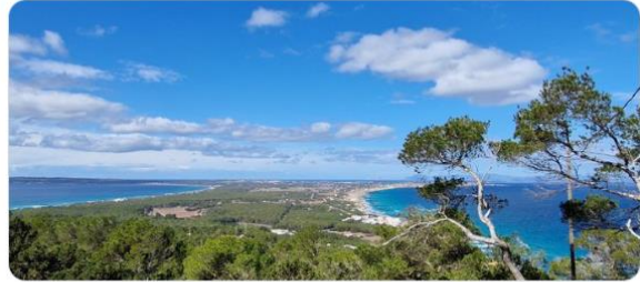
View of Formentera Island, a paradise in the Mediterranean Sea

6:51 p. m. · 27 feb. 2024 · 1.038 Reproducciones