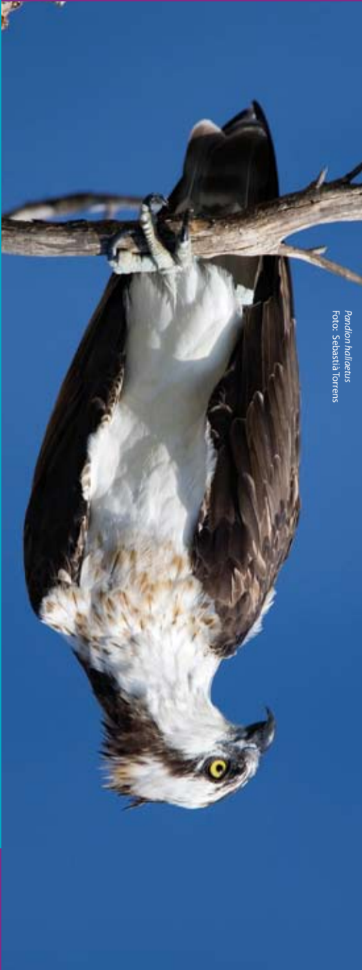
Pandion haliaetus