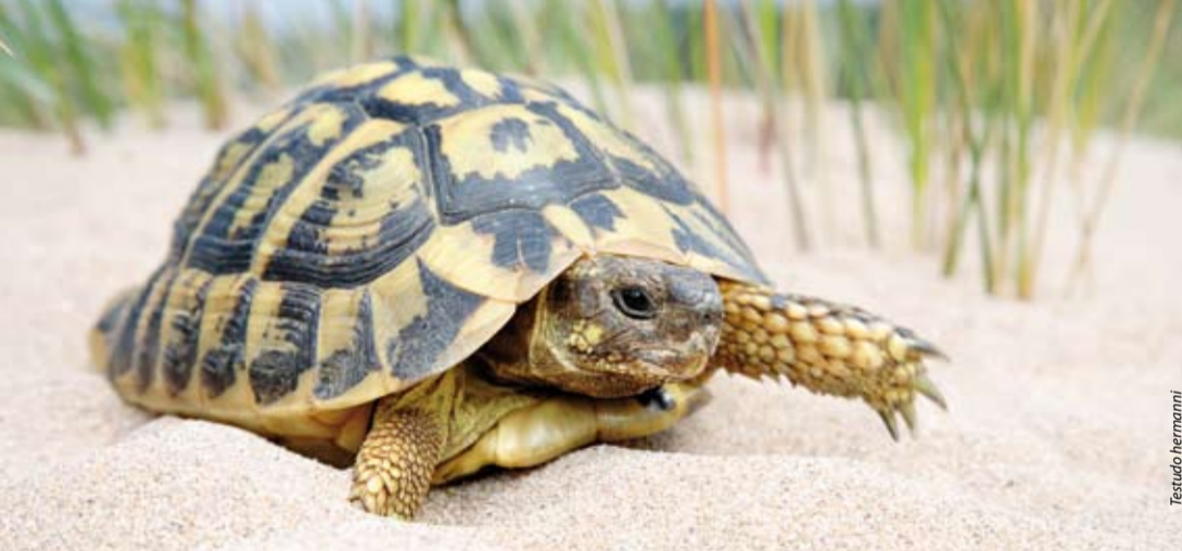
Testudo hermanni