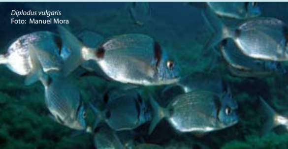
Diplodus vulgaris

Zu dem Naturpark gehören einige landwirtschaftlich genutzte Gebiete mit kleinen Forsten, in dem der Eingriff durch den Menschen eine Landschaft mit großer Artenvielfalt an Fauna und Flora begünstigt hat. Ausgedehnte Kuh- u. Schafweiden, Felder für Futtergetreide wechseln sich ab mit Brachland und mehr oder weniger dicht bewachsenen Olivenhainen. Das Ergebnis ist ein Mosaik aus verschiedenen Landschaften mit einer Vielfalt an Lebensräumen, in dem zahlreiche Tier- und Pflanzenarten zu Hause sind. Diese Vielfalt beruht auf einem Gleichgewicht, für das die Viehzucht eine wichtige Rolle spielt.