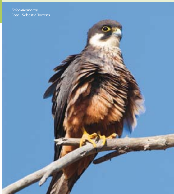
Falco eleonorae

una subespecie endémica ( Podarcis lilfordi giglioli ) que no existe en ninguna otra parte del mundo, así como el caracol ( Iberellus balearicus ), también endémico de Baleares.