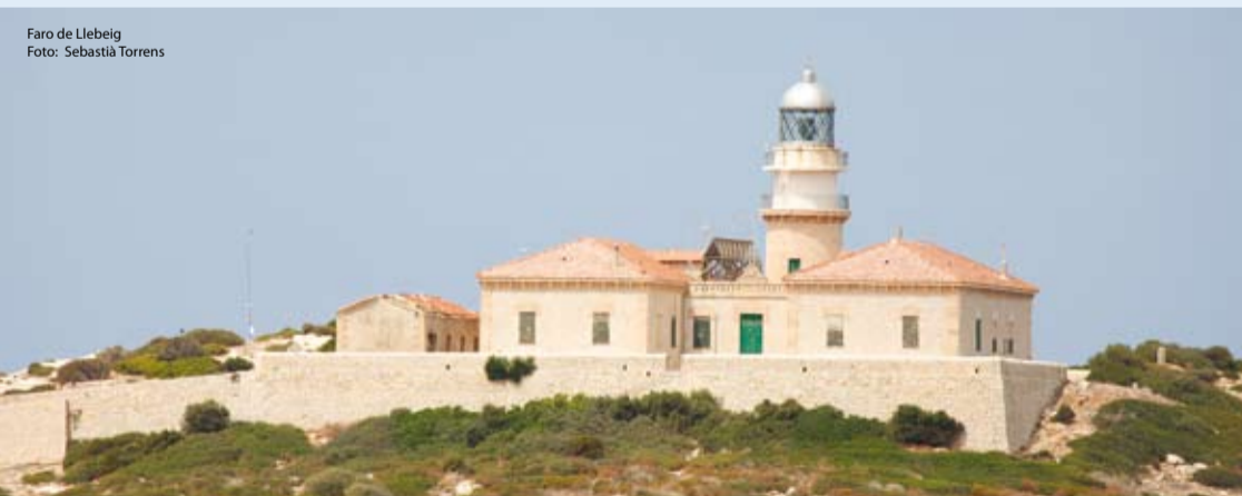
Faro de Llebeig

El camino hacia la conservación del espacio no fue fácil, y en buena parte su protección se debe a la fuerte presión popular en contra del intento de urbanización de la isla en los años 70. Por este motivo Sa Dragonera es uno de los símbolos del conservacionismo balear. En el año 1987 el Consell de Mallorca adquirió la isla, que fue declarada Área Natural de Especial Interés (ANEI). Finalmente, en el año 1995 se convirtió en Parque natural.