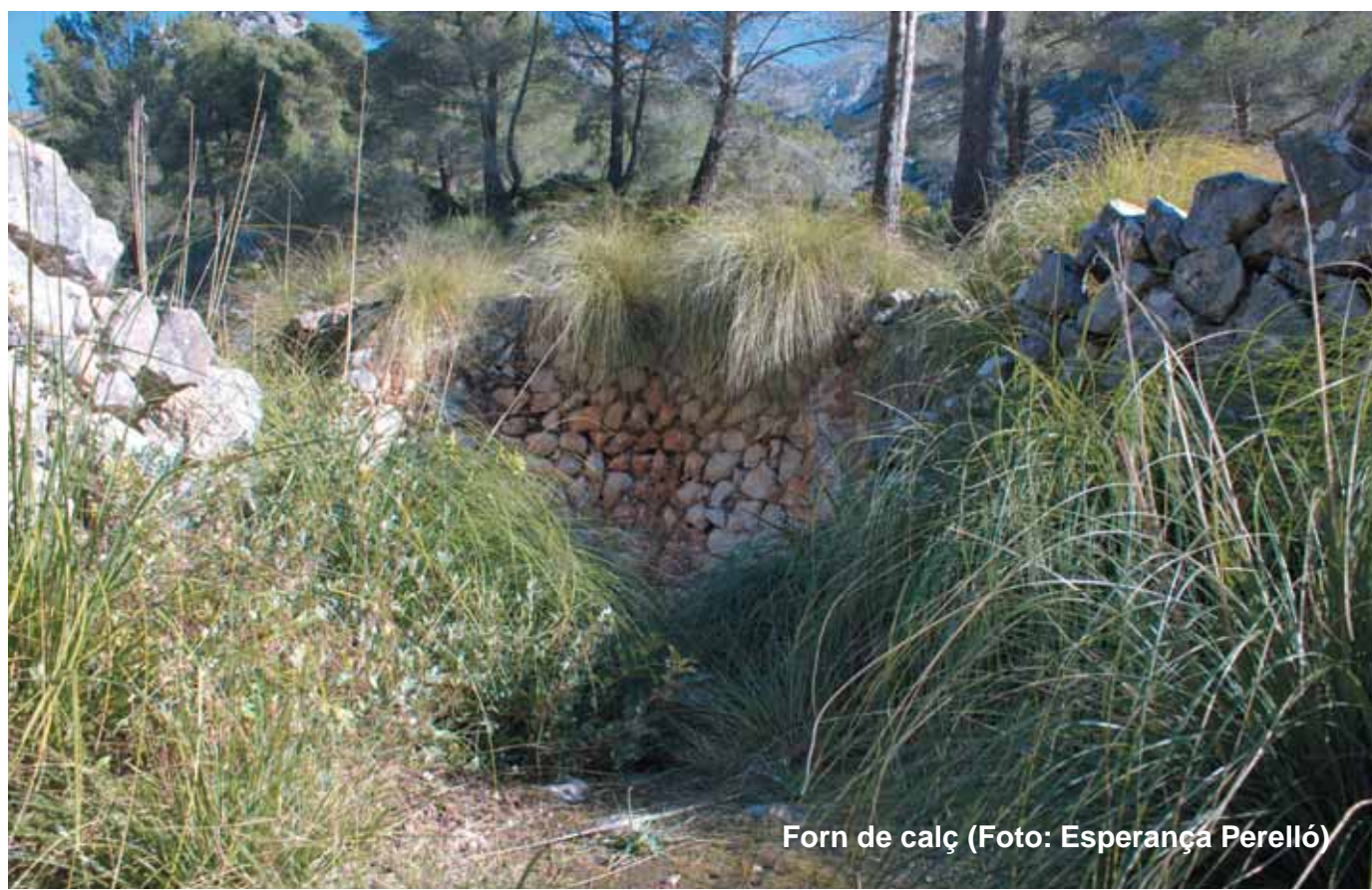
Forn de calç

En aquesta zona, prop de les sitges hi ha dos forns de calç. Els calciners trobaren aquí tots els elements necessaris per produir calç: pedra calcària (pedra viva) i llenya. La proximitat al torrent de Galatzó també els assegurava l'abastiment d'aigua.