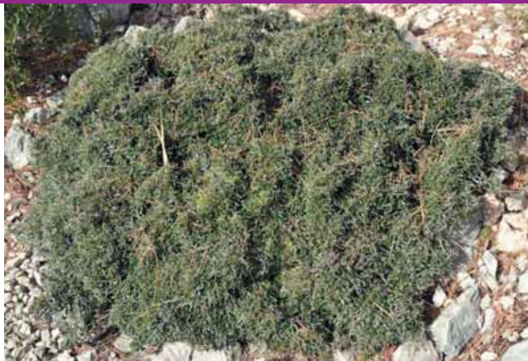
Espinaler o mal hivern, Rhamnus bourgeanus

endemismes vegetals, com ara el trèvol de quatre fulles ( Lotus tetraphyllus ) i l'espinaler o mal hivern ( Rhamnus bourgeanus ).