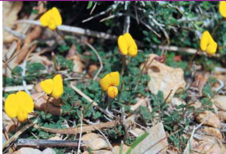
Trèvol de quatre fulles, Lotus tetraphyllus

Una vegada que hem gaudit de la vista des del mirador, tornam enrere fins al pou de ses Sínies. De la nostra esquerra parteix un tirany senyalitzat que ens porta fins al poblat de navetiformes de ses Sínies. Es tracta d'un poblat de l'edat del bronze, datat entre el 1.700 i el 900 aC, i format per construccions de pedra en forma de ferradura allargada (nau). La seva funció era servir d'habitatges. Només una de les estructures és fàcilment identificable, ja que la resta es troba envaïda per la vegetació. Això no obstant, les restes disperses han permès als experts suposar que en aquest indret hi havia hagut una població permanent bastant nombrosa.