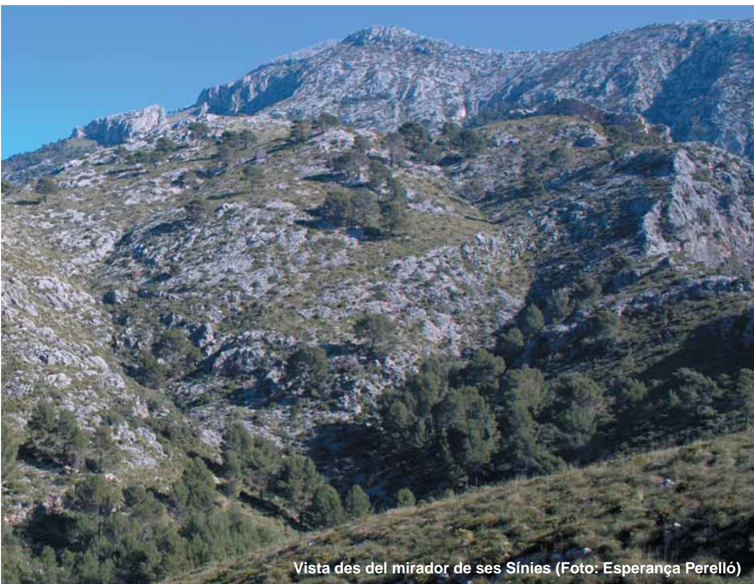
Vista des del mirador de ses Sínies