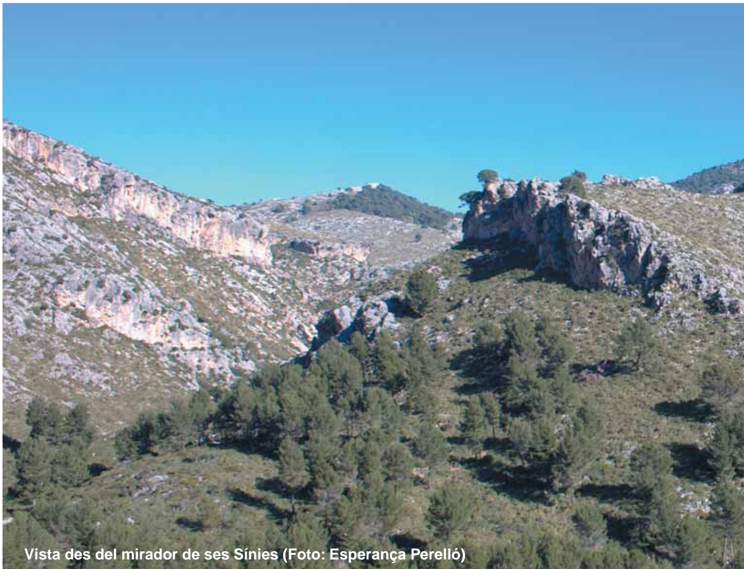
Vista des del mirador de ses Sínies