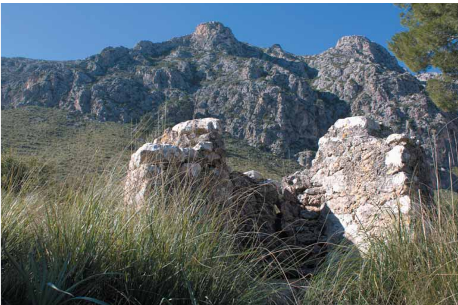
Pou de ses Sínies

Les rotes normalment són terres poc fèrtils o allunyades de les cases de possessió. Les restes d'habitatges que s'han conservat ens fan pensar que la vida del roter devia ser ben dura. Disposaven només de senzilles barraques de pedra en sec amb un fumeral com a únic luxe.