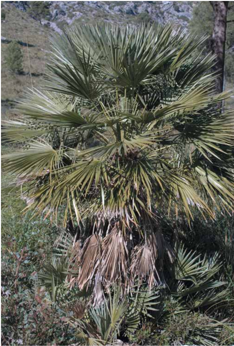
Garballó, Chamaerops humilis

lianes com l'arritja ( Smilax aspera ) s'arrepengen arreu com a bones enfiladisses. També són abundants les aferradisses estepes negres ( Cistus monspeliensis ), els olorosos romanins ( Rosmarinus officinalis ) i els brucs ( Erica arborea ).