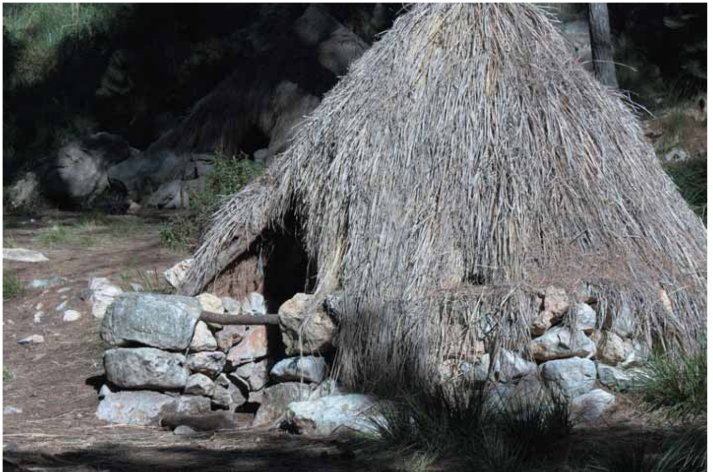
Barraca de carboner

El camí segueix paral·lel al torrent mentre el terreny es torna més abrupte. La vegetació també ha canviat: hem deixat enrere el bosc i ara el que domina són les carritxeres ( Ampelodesmos mauritanica ) i el garballons ( Chamaerops humilis ). Tot i això, continuem trobant ranxos de carboner i forns de calç. Si tenim en compte que ambdós elements es construïen sempre a llocs on abundava la llenya i la pedra, podem pensar que en el passat hi havia hagut un bosc en aquest lloc. Probablement la sobreexplotació i els efectes d'un incendi han provocat aquest canvi.