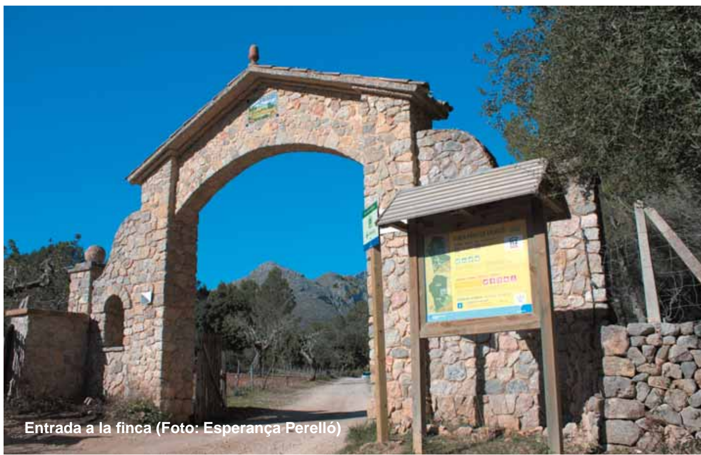
Entrada a la finca