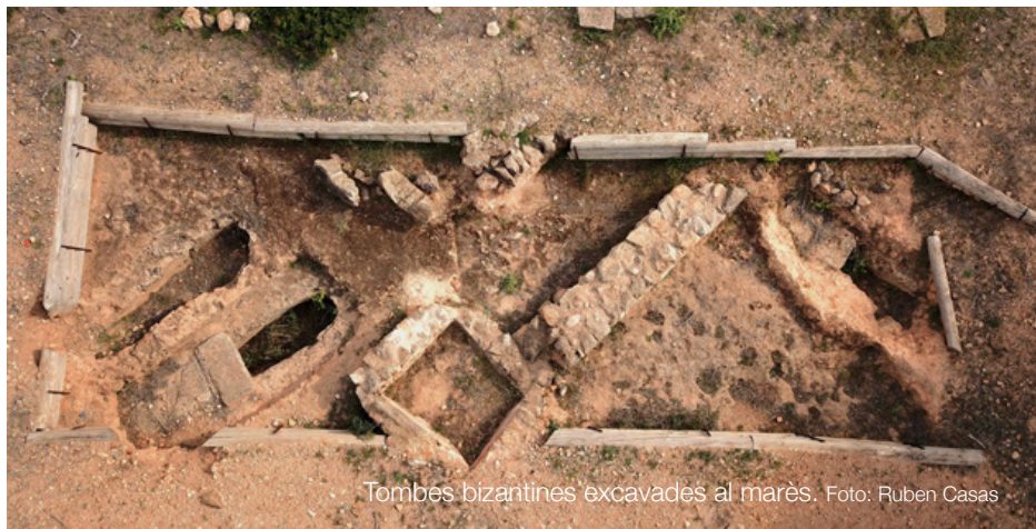
Tombes bizantines excavades al marès.

A mesura que baixam veim la badia del port, que ens indica que estam a la part final de l'itinerari. Un senyal en el camí ens informa que, girant a l'esquerra, trobarem la necròpolis bizantina.