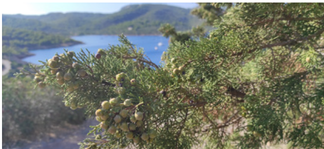
Juniperus phoenicea

Seguint el caminó travessam un bosc espès dominat pel pi blanc, que comparteix l'espai amb altres espècies com ara la savina, la mata, el romaní ( Salvia rosmarinus ), l'aladern de fulla estreta ( Phillyrea angustifolia ), el xiprell ( Erica multiflora ), diferents tipus d'estepes ( Cistus sp. ) o el llampúdol bord ( Rhamnus ludovici-salvatoris ), una de les espècies endèmiques més representatives de Cabrera. Si param atenció, podrem apreciar petites plantes, molses i líquens, i escoltar els sons dels insectes o el cant d'algunes aus.