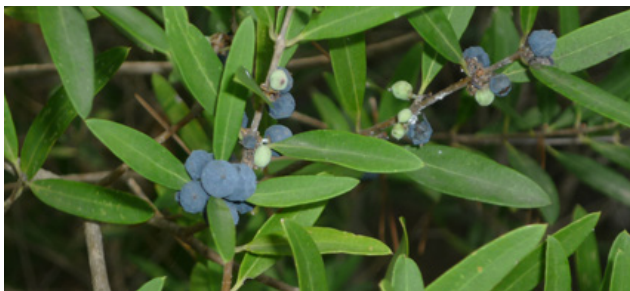
Phillyrea angustifolia