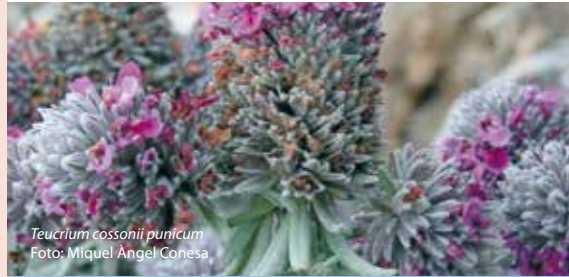
Teucrium cossonii punicum

La flora submergida també és diversa i està representada principalment per praderies de fanerògames marines entre les quals és remarcable l'espècie endèmica de la Mediterrània, la Posidonia oceanica .