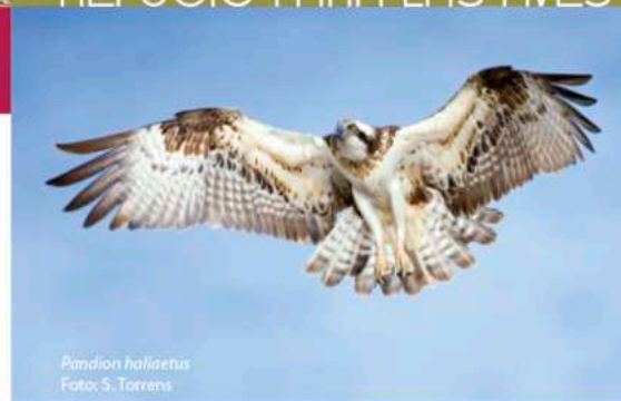
Pandion haliaetus

Como otros humedales del Mediterráneo, s'Albufereta es un enclave de vital importancia para las aves acuáticas durante las migraciones anuales. Así mismo, durante las rigurosas sequías estivales propias del clima mediterráneo las zonas húmedas como s'Albufereta se convierten en auténticos oasis para muchas aves.