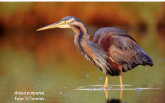
Ardea purpurea

La Reserva Natural protege una superficie de 211 hectáreas y a su alrededor las 290 hectáreas de su periferia de protección tienen reguladas algunas actividades y usos para evitar impactos indeseados sobre la misma.