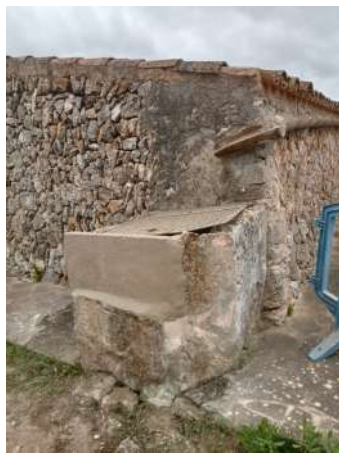
Reparació de la cisterna de Can Biga