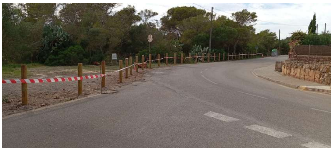
Imatge 7 – Instal·lació de pals en el camí des Cap de sa Paret

A finals d'agost es va obtenir l'autorització per part de l'Ajuntament i el mes d'octubre s'instal·laren els pals. Amb aquesta actuació es pretén donar compliment a l'article 45 del Pla d'ordenació del recursos naturals de Mondragó, aprovat pel Decret 10/2022 de 4 d'abril, d'acord amb el qual els vehicles a motor han d'estacionar en els aparcaments habilitats per a aquest fi o a la calçada dels sectors urbans en què estigui permès l'estacionament.