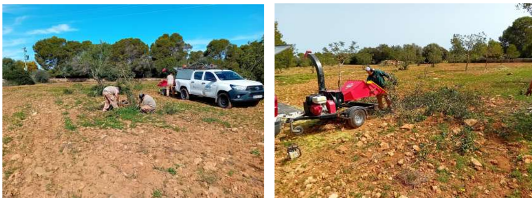
Imatges 9 i 10 - Retirada de rebrots i trituració de restes a la finca agrícola de can Parra

El mes de març i abril s'han podat i llevat rebrots dels garrovers, ametllers i figueres de les finques de can Parra, can Biga, can Vicenç. I el mes de maig s'han podat les figueres de la finca de ca sa Muda. Aquestes actuacions han estat realitzades per una brigada de s'Estel de Llevant. Les restes vegetals de poda s'han triturat al mateix lloc.