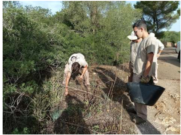
Imatges 15 i 16 - Exemples de Kalanchoe daigremontiana i retirada per part d'una brigada d'Aproscop (28-10-2024)