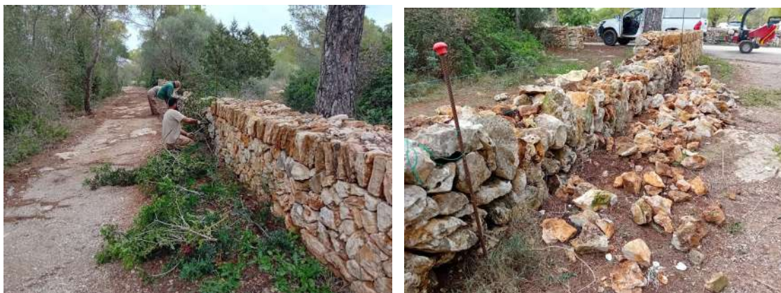
Imatges 25 i 26 -Reparació de paret seca (29/10/2024)

Les tasques de reparació s'han iniciat a finals del mes d'octubre i es preveu que estiguin finalitzades el mes de desembre.