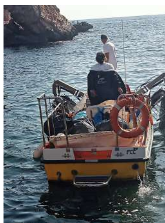
Neteja del caló des Savinar. Coordinació amb el Servei de Neteja del Litoral