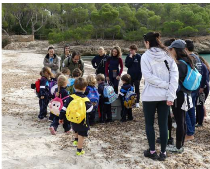
Imatge 28 -Activitat escolar i amollada de tortugues amb la Fundació Palma Aquàrium

* Durant l'any 2024 s'han realitzat dues visites prèvies virtuals: al col·legi La Salle de Palma, amb 155 participants i al Ceip Nostra Sra de Consolació de s'Alqueria Blanca, amb 25 participants