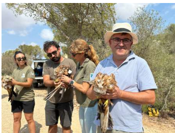
Imatges 9 i 10 - Amollada de milanes ( Milvus milvus )