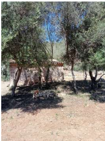
Manteniment dels voltants de la caseta de s'Hort d'en Metge