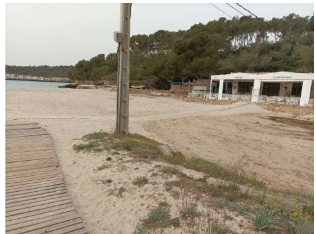
Imatges 21 i 22 – Fotografies del suport de formigó de ses Fonts de n'Alis que es vol retirar

Per poder retirar aquest suport és necessari soterrar el cable elèctric que subministra electricitat a l'estació de bombeig d'aigües residuals. Tot i que en el Programa anual d'execució estava previst que el Servei d'Espais Naturals encarregàs la redacció del projecte, finalment ha estat l'Agència Balear de l'Aigua i Qualitat Ambiental (ABAQUA) l'administració que ha encapçalat aquest projecte.