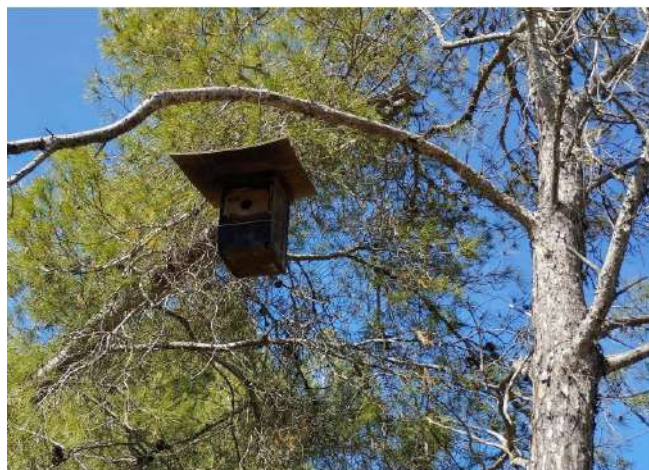
Imatge 30 - Caixa niu

A les caixes instal·lades per òliba i xoriguer enguany tampoc s'hi ha detectat ocupació.