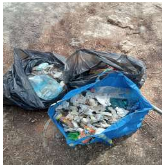
Imatges 15 i 16 - Residus acumulats al final de torrent de s'Amarador

El mesos de febrer i març s'avançaren els pals de tancament al front davant del sistema dunar per tal de protegir les noves formacions de dunes embrionàries. També es varen retirar els contenidors de fems de la platja, perquè afectaven l'acumulació d'arena i alteraven l'evolució natural.