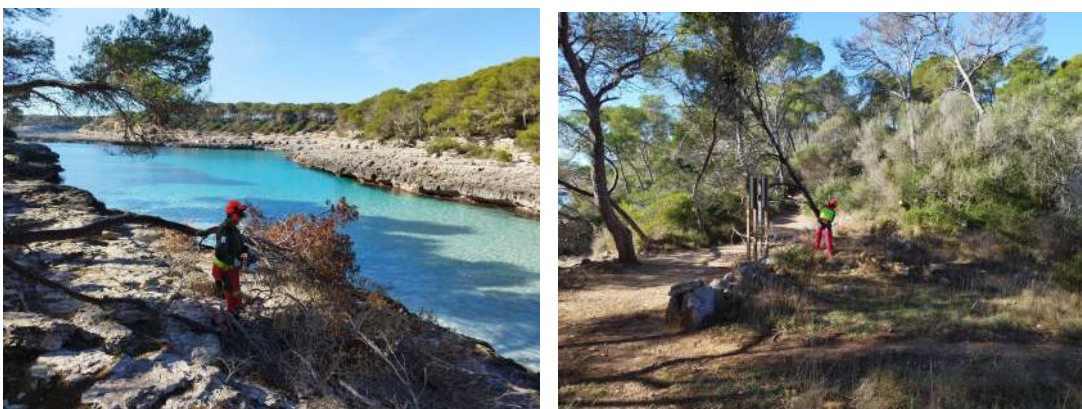
Imatges 3 i 4 – retirada de pins al caló des Burgit (26-01-2024)