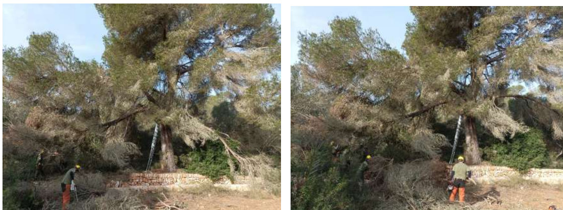
Imatges 5 i 6 – Tasques de poda del pi de s'Hort des Metge

Aquesta feina puntual han estat realitzada per una brigada forestal de suport.