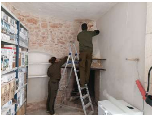
Manteniment a l'oficina de Can Crestall