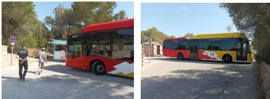
Imatges 26 i 27 – Proves per traslladar l'aturada de bus de la línia L-507 Cala d'Or-Cala Mondragó (12-07-2024)

L-507 Cala d'Or-Cala Mondragó. Actualment es troba a la part final de la via d'accés a la platja de ses Fonts de n'Alis i es vol traslladar a l'alçada de l'aparcament de ses Fonts de n'Alis, d'acord amb les indicacions del PORN. L'objectiu és d'una banda evitar col·lapses circulatoris en el tram final de la via d'accés a la platja i de l'altra garantir la seguretat dels vianants.