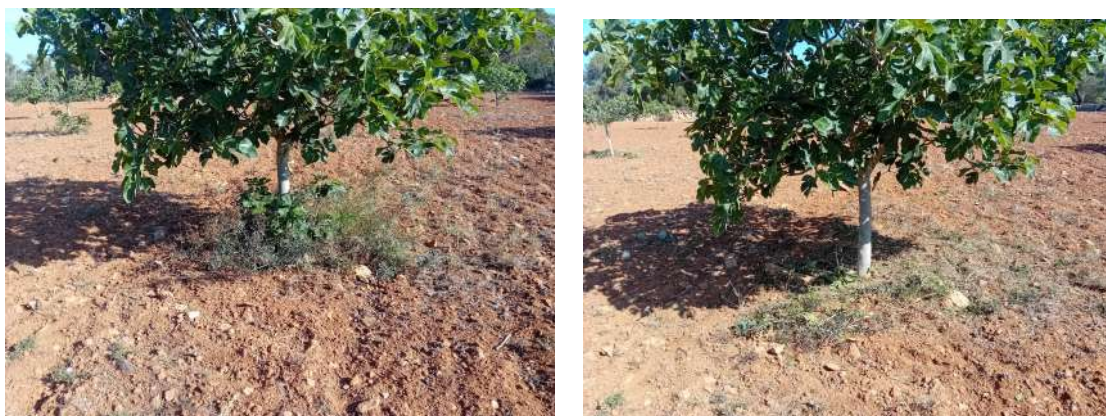
Imatges 11 i 12 - Retirada de rebrots i trituració de restes de les figueres de ca sa Muda

Durant els mesos d'estiu s'han realitzat regs als fruiters més joves, especialment a ca na Martina que es plantaren el desembre de l'any passat.