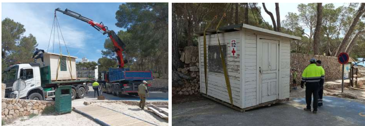
Imatges 17 i 18 – Fotografies de la instal·lació de la nova caseta de socorristes

Així mateix durant el mes de maig l'Ajuntament de Santanyí va substituir la caseta de socorristes que hi havia damunt la platja per una de menors dimensions a damunt la zona asfaltada.