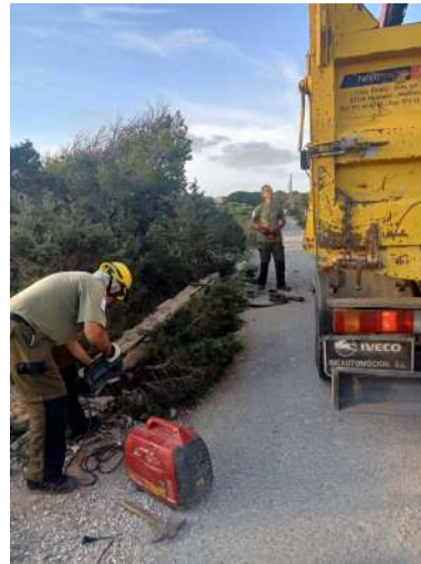
Imatges 19 i 20 – Fotografies de la retirada del suport de formigó (09-10-2024)