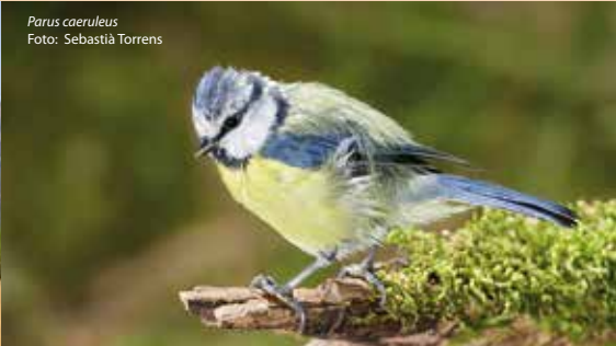
Parus caeruleus