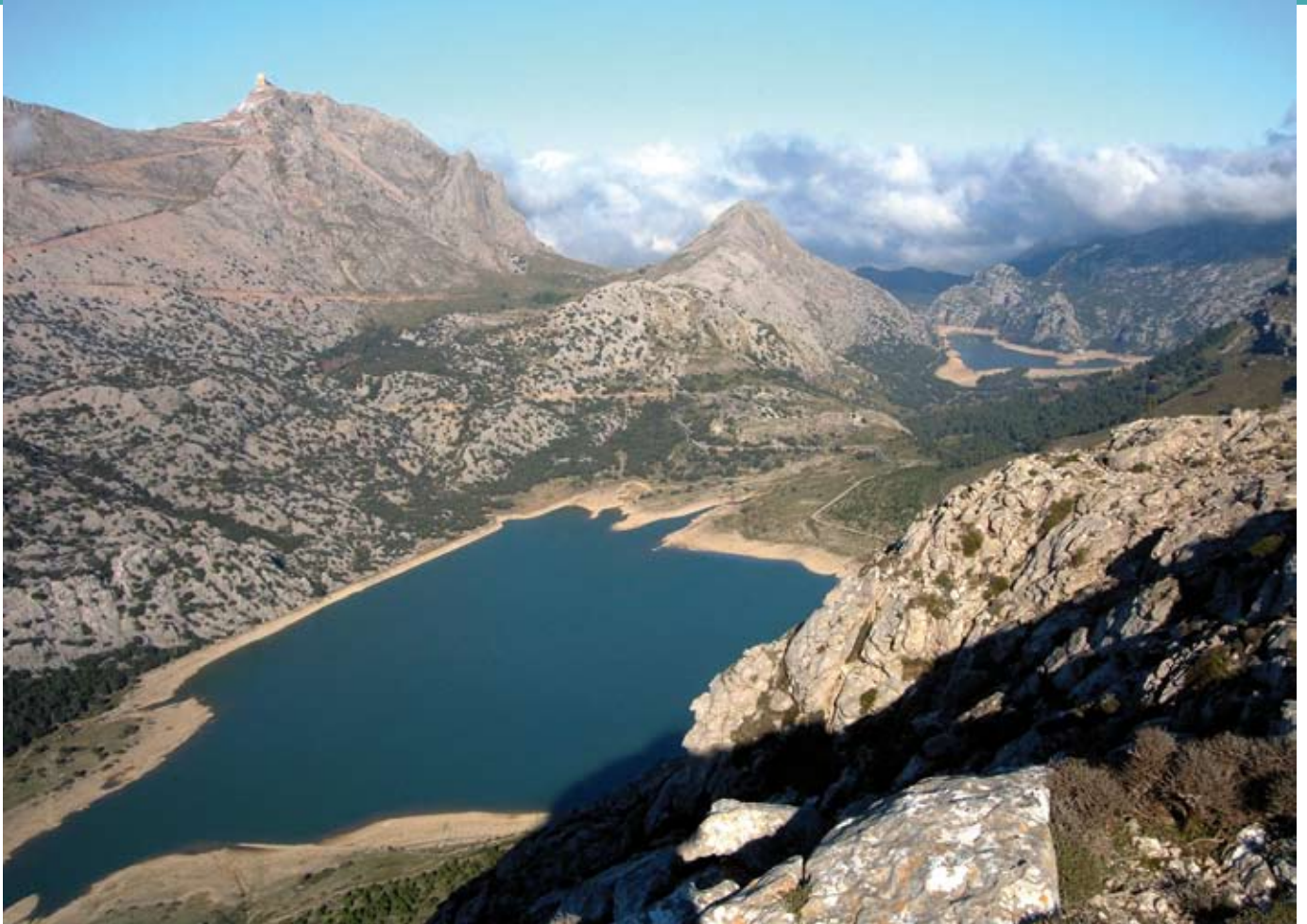
Stausee von Cúber und Gorg Blau

Bis Anfang des 20. Jahrhunderts war Cúber ein großes Landgut, das sich hauptsächlich der Landwirtschaft und extensiven Schafszucht widmete. Die landwirtschaftliche Nutzung war auf den unteren Teil des Tals konzentriert, wo die beste Erde für Weideland und Getreideanbau vorhanden war. Bei der Überschwemmung des Cúber-Tals im Jahr 1972 wurden die Häuser dieses Guts, die Felder und die Weiden zerstört und die Landwirtschaft in der Gegend wurde aufgegeben.