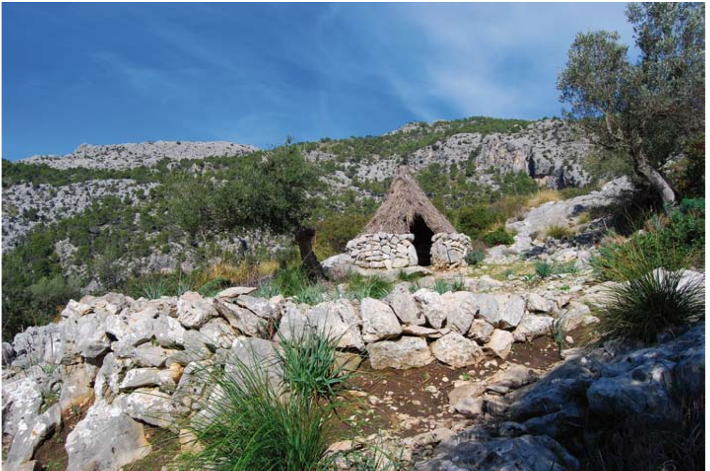
Rotlo de sitja und Köhlerhütte

Diese Steingebäude erinnern uns daran, dass bis vor nicht allzu langer Zeit das Köhlergewerbe für die meisten Landgüter in der Serra von sehr großer Bedeutung gewesen ist. Am liebsten arbeiteten die Köhler in den Steineichenwäldern, denn das Holz der Steineichen ist hervorragend zum Gewinnen von Holzkohle geeignet. Deshalb finden wir die meisten Rotlos de sitja an den mit Steineichen bewachsenen Hängen.