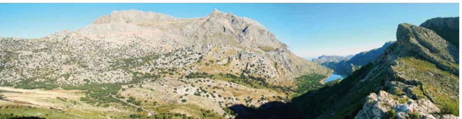
Blick vom Coll de la Coma des Ases auf den Penyal del Migdia, den Puig Major und den Puig de ses Vinyes (Foto: Gràcia Salas).