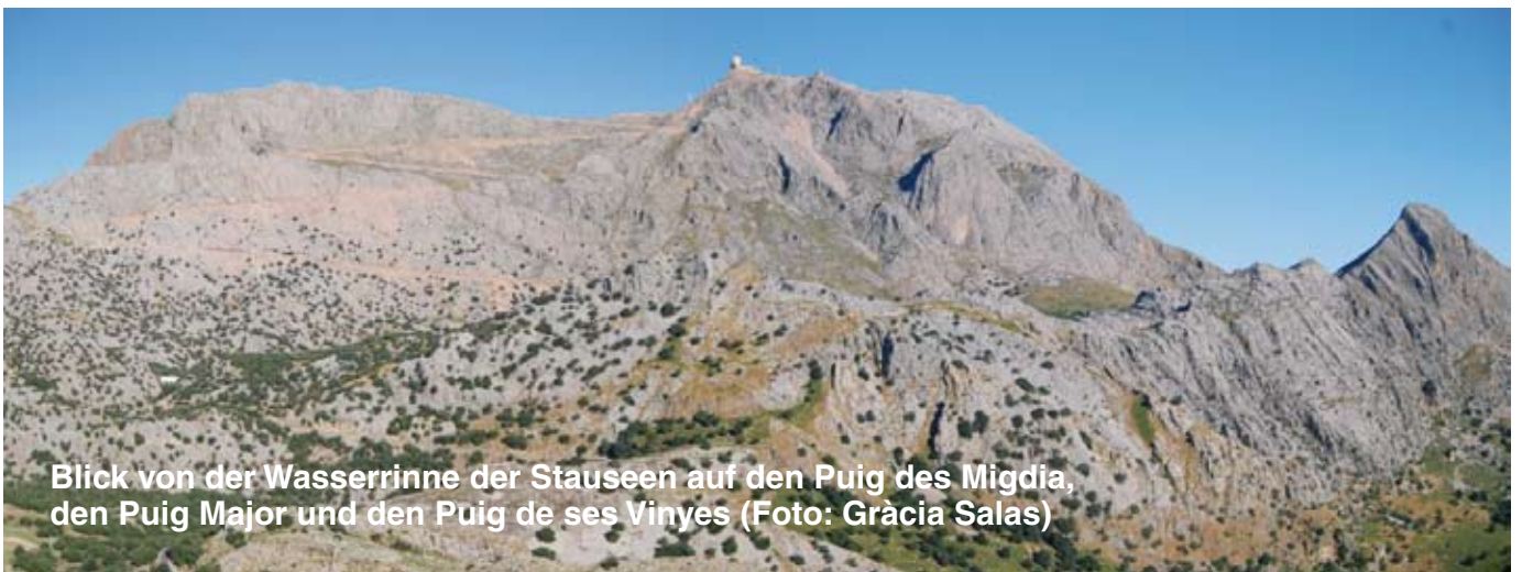
Blick von der Wasserrinne der Stauseen auf den Puig des Migdia, den Puig Major und den Puig de ses Vinyes

begleiten. Wenn wir dann in das Gebiet kommen, wo vor etwa dreißig Jahren eine Wiederaufforstung mit Schwarzkiefern ( Pinus nigra ) vorgenommen wurde, wissen wir, dass wir ganz in der Nähe unseres Ausgangspunkts sind. Aber bevor wir zur Font des Noguer kommen, sollten wir noch auf eine Steineiche achten, die ganz alleine in der Landschaft steht und auf die Berge blickt.