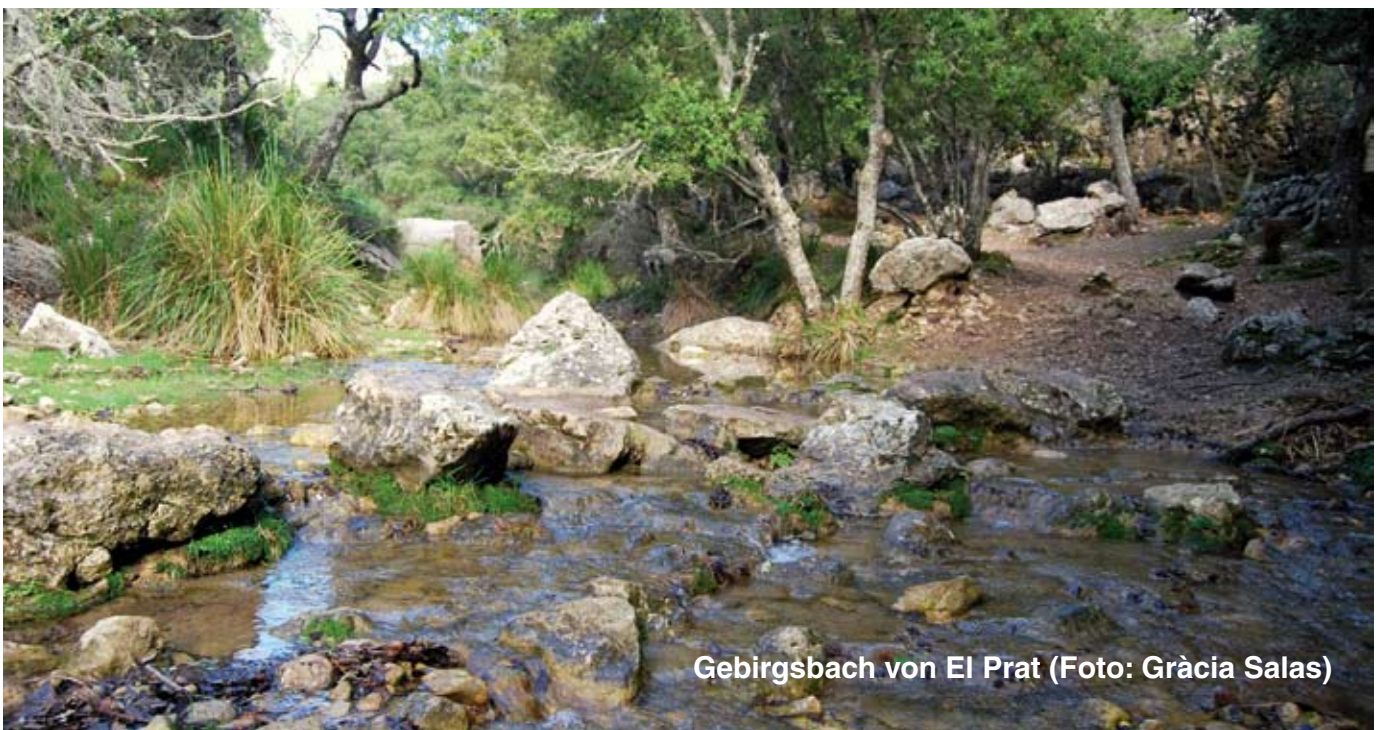
Gebirgsbach von El Prat

Kurz darauf überqueren wir den Gebirgsbach wieder, diesmal über eine Holzbrücke, und gehen bergauf, bis wir zu einer Wegkreuzung kommen. Wenn wir möchten, können wir kurz von unserer Route abweichen und zur Quelle namens Font des Prat de Massanella weitergehen, die das ganze Jahr über sprudelt und mit der Canaleta de Massanella kanalisiert wurde.