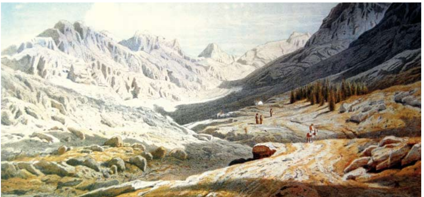
Blick von der Umgebung des Coll de l'Ofre auf das Cúber -Tal auf dem Stich "Die Balearen" des Erzherzogs Luis Salvador

Nachdem König Jaume I Mallorca erobert hatte, war das Gebiet der Muntanyes der Teil der Insel, den der König für sich behielt und dann unter seinen Mitstreitern bei der Eroberung verteilte. Im Llibre del repartiment , dem Aufteilungsverzeichnis, erscheint das Gut mit einer Fläche von fünfzehn Jovades (die Jovada war ein landwirtschaftliches Flächenmaß, das dem Stück Land entsprach, das ein Ochsenpaar an einem Tag pflügen konnte, nämlich etwa 11,36 Hektar).