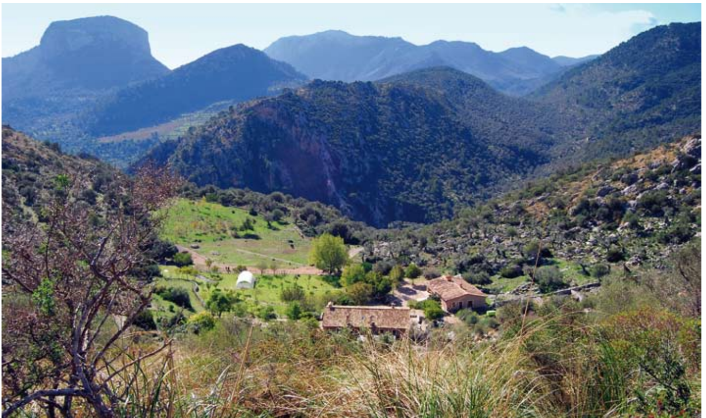
Schutzhütte von Tossals Verds

Nach kleineren An- und Abstiegen über ein jetzt felsigeres Gelände kommen wir zum Olivenhain von Es Tossals Verds, ein Beispiel der gelungenen Ausgewogenheit zwischen Natur und landwirtschaftlicher Nutzung. Kurz darauf stoßen wir vor einer Felswand auf einen quer verlaufenden Weg. Dort biegen wir nach rechts ab und gehen an einem Holzgeländer entlang zum Refugio de Tossals Verds. Heutzutage bezeichnet dieser Name das Landgut, den Berg und die Gutshäuser. Das Wort Tossal bezieht sich auf eine "nicht sehr hohe, nicht sehr steile und nicht zerklüftete Anhöhe in einer Ebene oder isoliert von anderen Bergen". Das Adjektiv Verds (grün) ist auf die Färbung zurückzuführen, die das üppig wachsende Dissgras ( Ampelodesmos mauritanica ) einer Gegend verleiht, die den vorhandenen Dokumenten nach bereits sehr früh intensiv für die Viehzucht genutzt wurde.