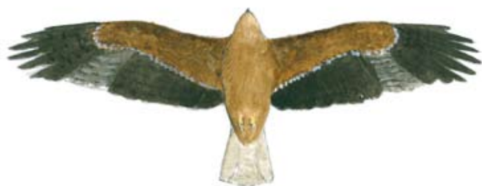
Forma clara i fosca de l'àguila calçada (Dibuix: Cati Artigues)

Un cop que hem conegut el primer assentament de població que s'ha documentat al Parc natural de la Península de Llevant, podem reprendre el camí de baixada. En aquesta zona, alçant la vista al cel, és habitual observar-hi el vol de l'àguila calçada o l'esparver ( Hieraaetus pennatus ), ja que el Parc natural compta amb una important població reproductora d'aquest bell rapinyaire.