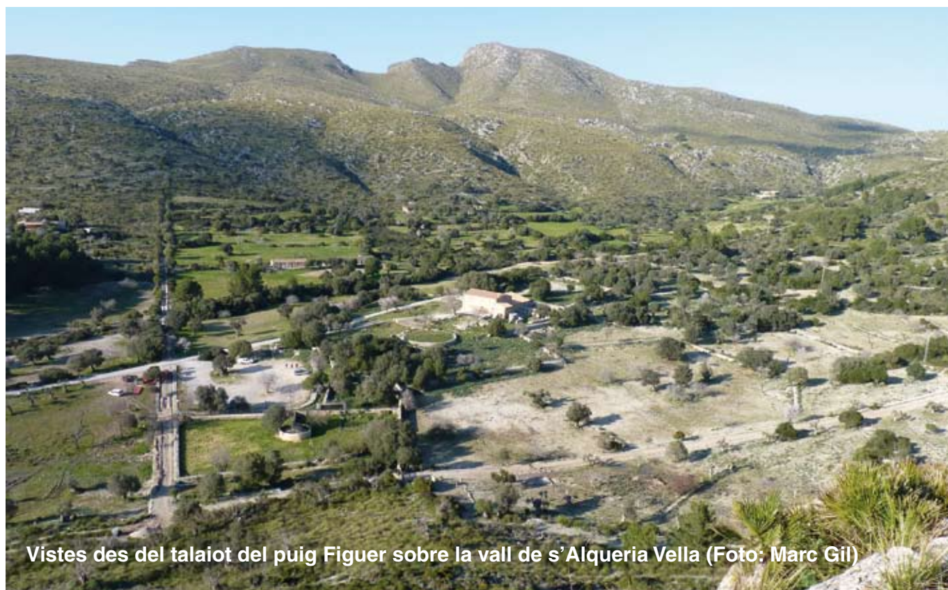
Vistes des del talaiot del puig Figuer sobre la vall de s'Alqueria Vella

Acabam la ruta a s'Alqueria Vella, entre oliveres i ametlers, al mateix lloc d'on hem sortit. Si la caminada se'ns ha fet curta, podem aprofitar per arribar fins al coll des Verger (a poc més d'un quilòmetre en direcció a les cases des Verger), des d'on podem gaudir d'una panoràmica molt diferent de la que hem tingut oportunitat de