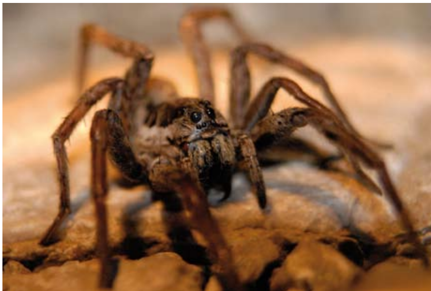
Aranya que habita el buit entre les pedres

Les parets seques, com la que acaba en aquest coll, conformen un hàbitat idoni per a molts animals: els dragons i les serps de garriga les fan servir per prendre el sol i per alimentar-se dels invertebrats (insectes, caragols, aranyes) que s'hi resguarden. A més, petits mamífers com la rata cellarda, el ratolí i el mostel hi troben amagatall, i també l'aliment que els proporcionen tant les bestioles que habiten els buits entre les pedres com la vegetació de bardissa que s'associa a les parets.