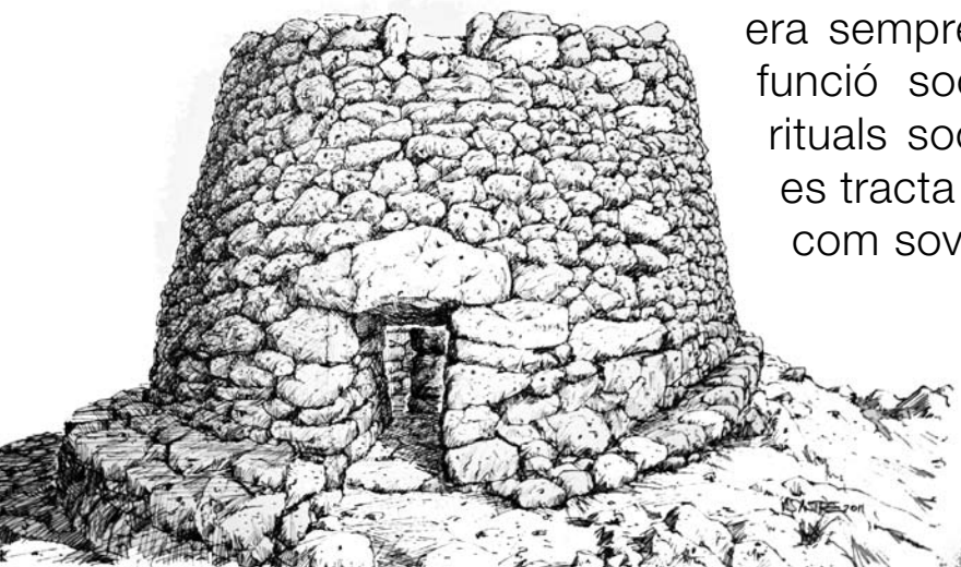
Reconstrucció del talaiot central (Dibuix: Vicenç Sastre)

El jaciment que veim presenta com a element predominant un talaiot central de forma circular, amb una columna interior central i dues alçades. Aquests tipus de construccions foren elements de prestigi per a les comunitats talaiòtiques, i l'ús que se'n feia era sempre comunal, és a dir, tenien una funció social que podia estar lligada a rituals socials i religiosos. Així doncs, no es tracta d'elements purament defensius, com sovint s'havia mantingut.