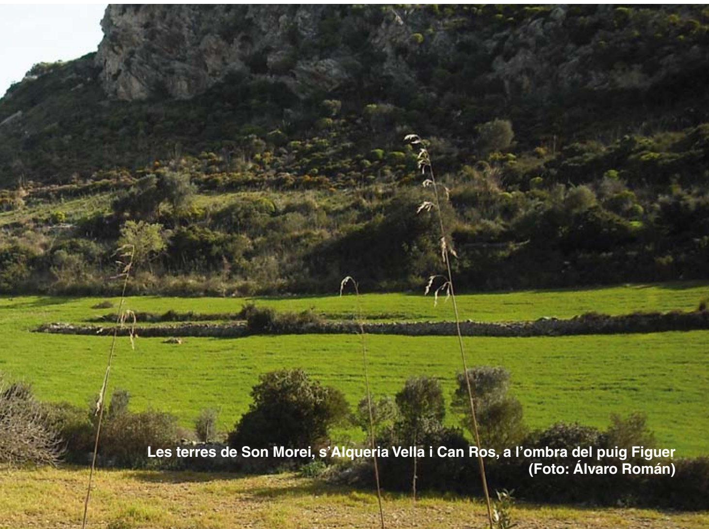
Les terres de Son Morei, s'Alqueria Vella i Can Ros, a l'ombra del puig Figuer

En aquest indret, les terres de Can Ros, hi destaca el cultiu de l'olivera, si bé en els terrenys més propers a les cases, tant a les de s'Alqueria Vella com a les de Can Ros, s'hi podia fer horta gràcies al sistema de rec propiciat tant per les canalitzacions d'aigua procedents de Son Morei com per la sínia que hem deixat a la nostra esquerra, construïda molt a prop del torrent i que fou restaurada fa uns anys pel departament de Patrimoni del Consell de Mallorca. La sínia és un element d'herència musulmana que s'utilitzava per treure aigua dels pous mitjançant la força d'una bèstia.