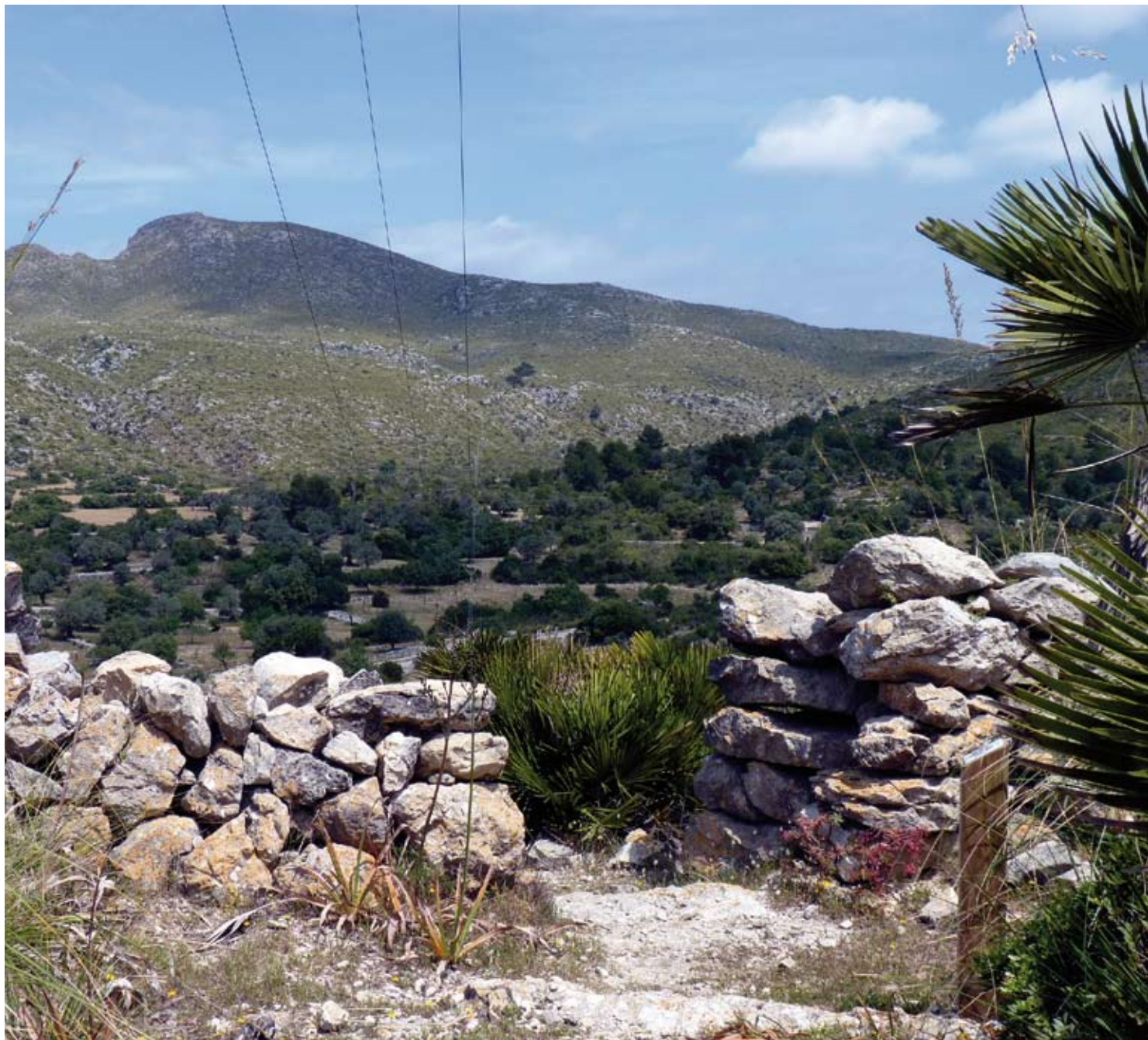
Portell des coll de sa Barrereta

Des de l'olivar de Can Ros, hem de prendre el caminet que remunta la falda del puig Figuer. Les vistes que tenim a l'abast s'amplien a mesura que pujam. Al coll de sa Barrereta trobam un portell molt adient per fer el primer descans durant la nostra caminada, des d'aquí tenim ja una visió espectacular de l'altre vessant del promontori, el de la zona sud.