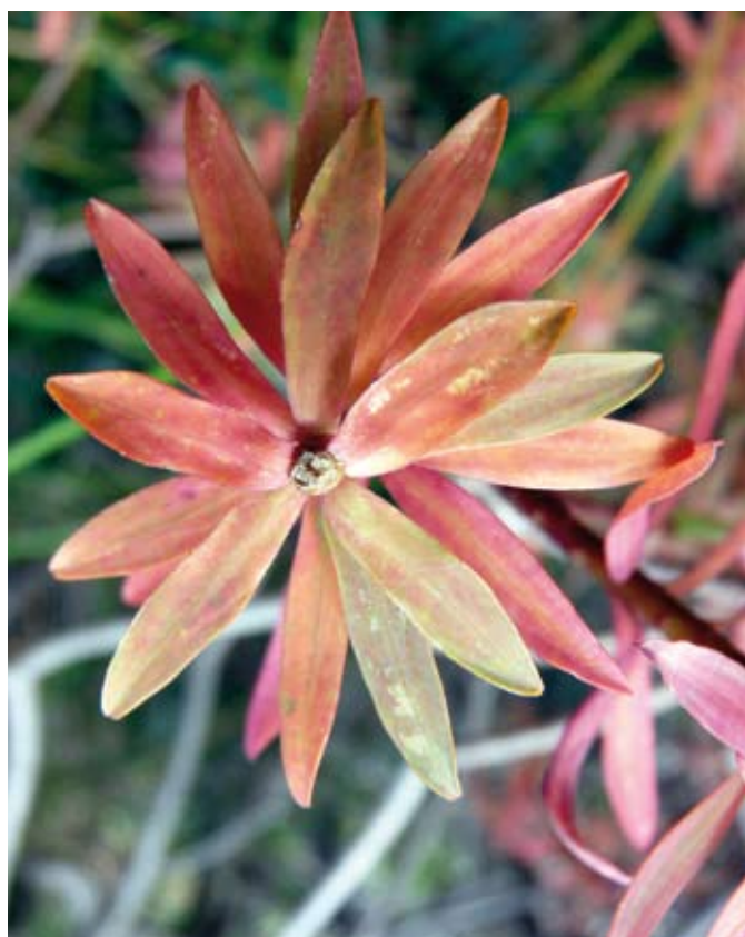
Detall de la lletrera

Si voltam a la dreta, passat el coll, seguim ascendint cap al cim del turó i ben aviat topam les primeres construccions corresponents al jaciment del puig Figuer, del qual parlarem més endavant.