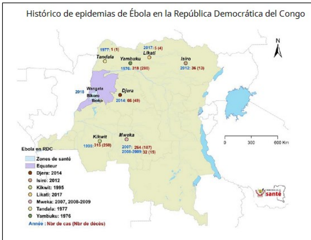
Histórico de epidemias de Ébola en la República Democrática del Congo

El fin del brote se declaró el día 24 de julio de 2018, fecha en la cual habían transcurrido dos periodos de incubación (42 días) desde la fecha de alta del último caso confirmado de EVE sin que se identificase ningún nuevo caso de la enfermedad. A fecha 12 de julio, se habían identificado y seguido a 1706 contactos.