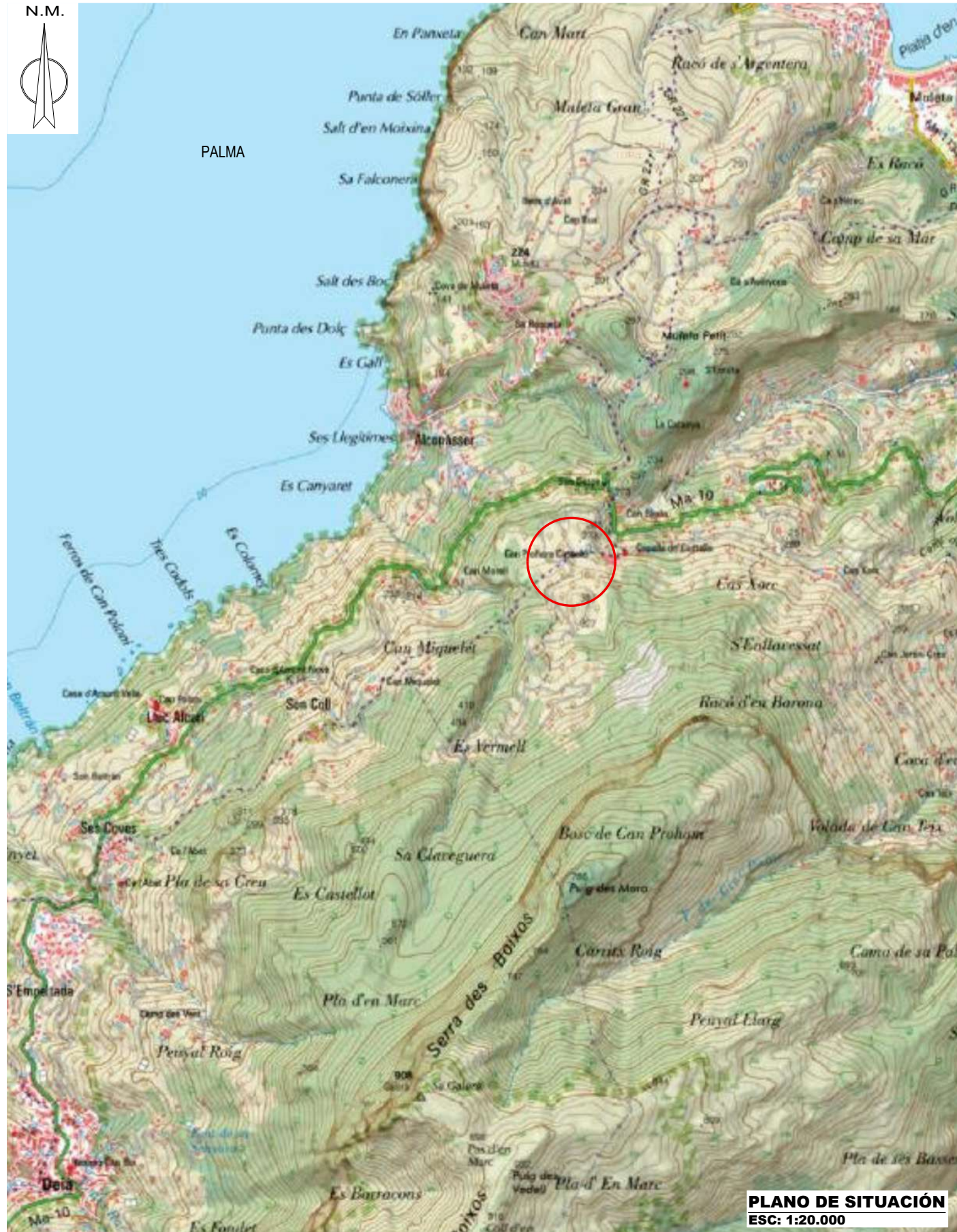
PLANO DE SITUACIÓN ESC: 1:20.000