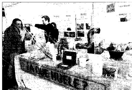
El salón acoge a empresas que ofrecen productos saludables como este tabificador de aceites.