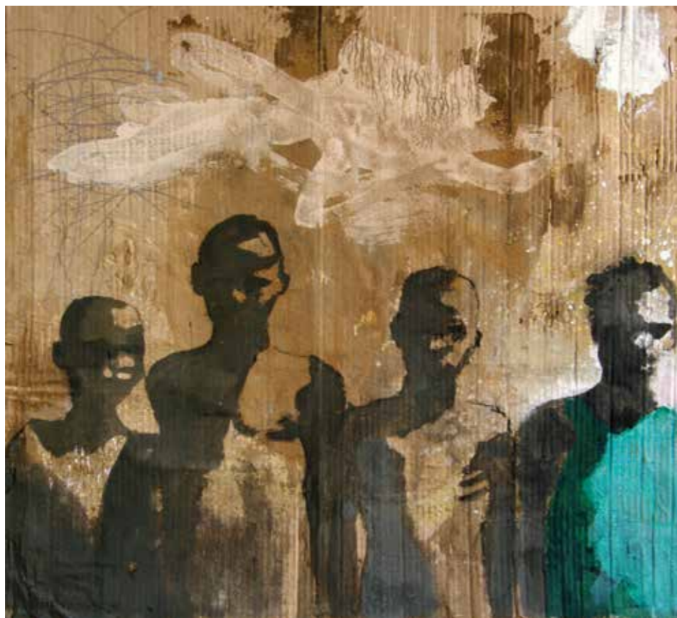
Figurantes Mixta sobre cartró 78x85 cm