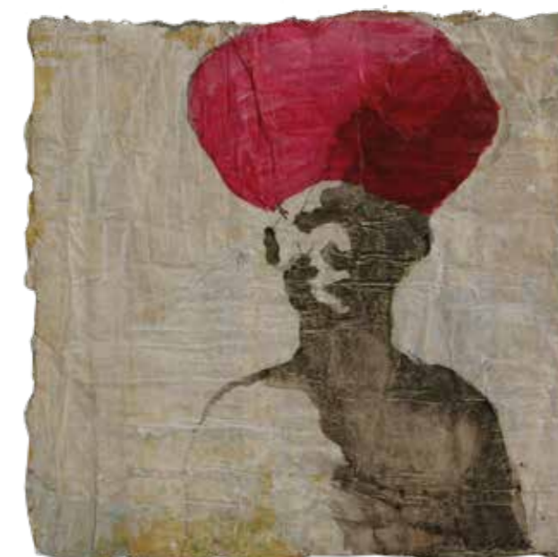
Turbante rojo Mixta sobre paper 36x36 cm