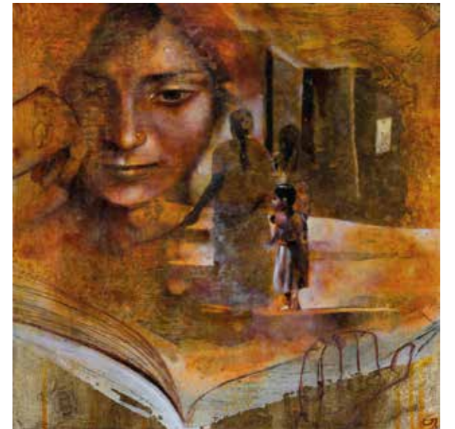
Títol: Memòria d'un llarg camí, 2020 Mixta sobre taula 40 x 40 cm