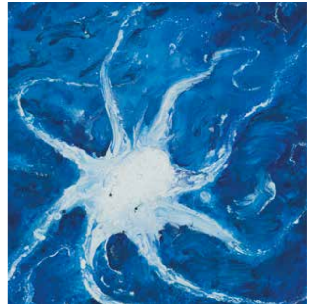
Marina pop 2 Acrílic damunt fusta 40 x 40 cm