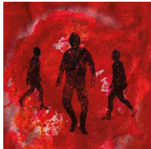
ODS 8 - IV, 2020 Tècnica mixta damunt tela 42 x 42 cm