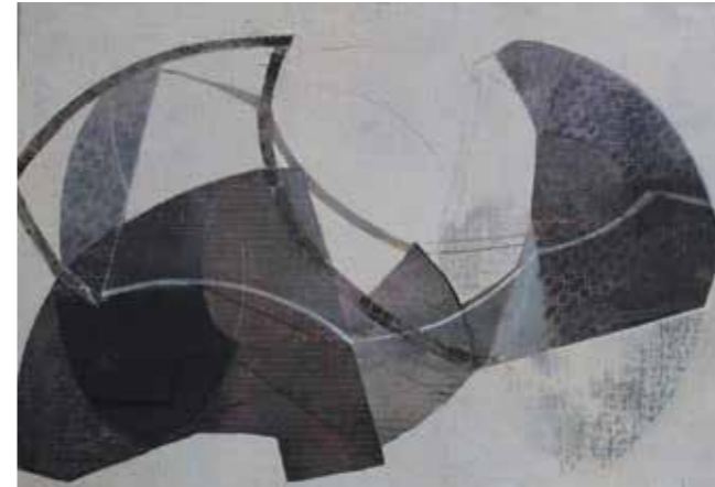
Movimiento Tècnica mixta sobre taula 35 x 24 cm