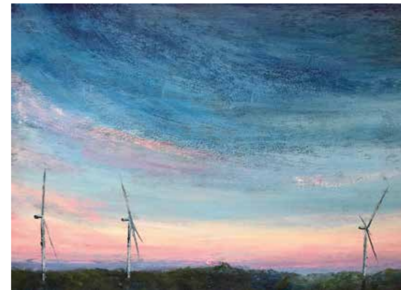
La força del vent Acrílic i pols de marbre sobre fusta 30,3 x 40 cm