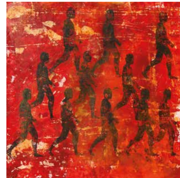
ODS 8 - II, 2020 Tècnica mixta damunt tela 90 x 90 cm