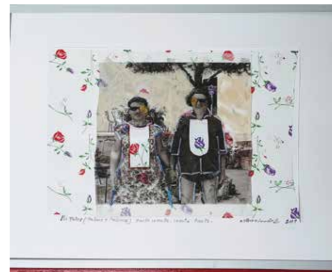
Los Pérez 2 (tanto monta, monta tanto), 2019 Mixta-collage sobre paper 32 x 41,5 cm