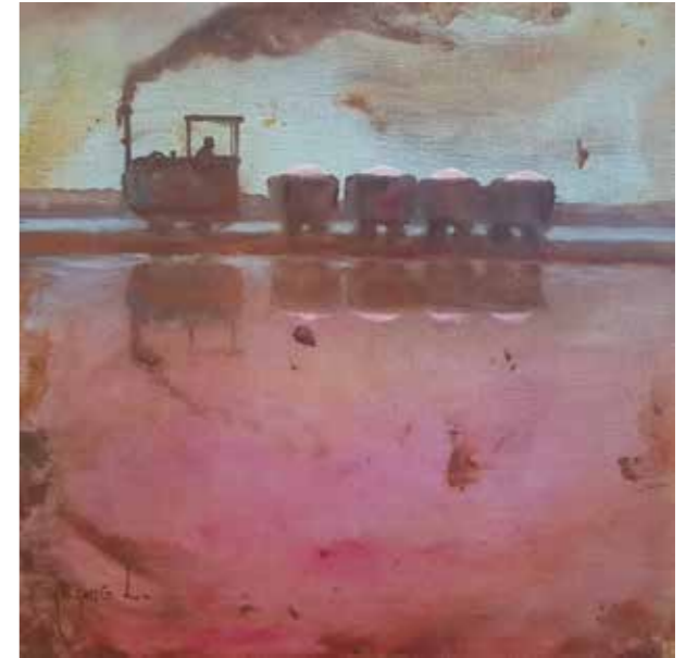
Recolección y exportación colaboración de la sal, 2020 Òxids i oli 40 X 40 cm