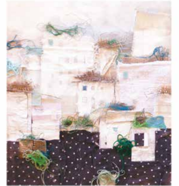
Ciutats resilientes i sostenibles, 2020 Tècnica mixta 100 X 100 cm