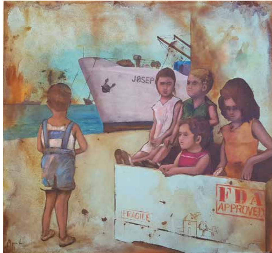
Niños en el puerto de entrada y salida de mercancías la cooperación, 2020 Òxids i oli 100 X 100 cm