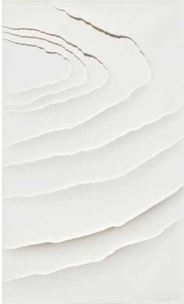
Obra 1, 2020 Paper sobre paper, llum i ombra 100 x 60 cm