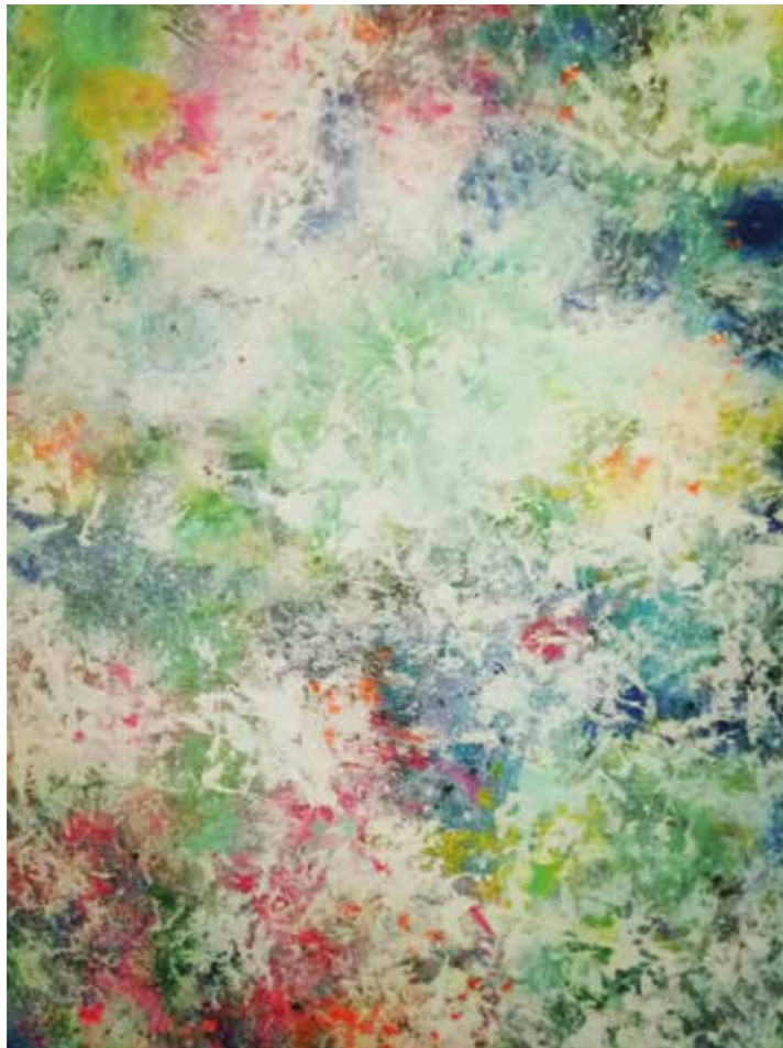
Eaux propres Acrílic sobre tela 100 x 100 cm