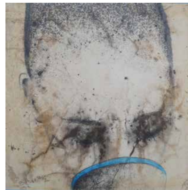
Per l'agricultura sostenible, 2020 Acrílic i grafit sobre paper japonès muntat sobre fusta 40 x 40 cm