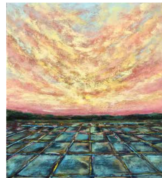
La força del sol Acrílic i pols de marbre sobre fusta 32,5 x 29,5 cm