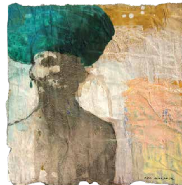
Turbante verde Mixta sobre paper 36x36 cm