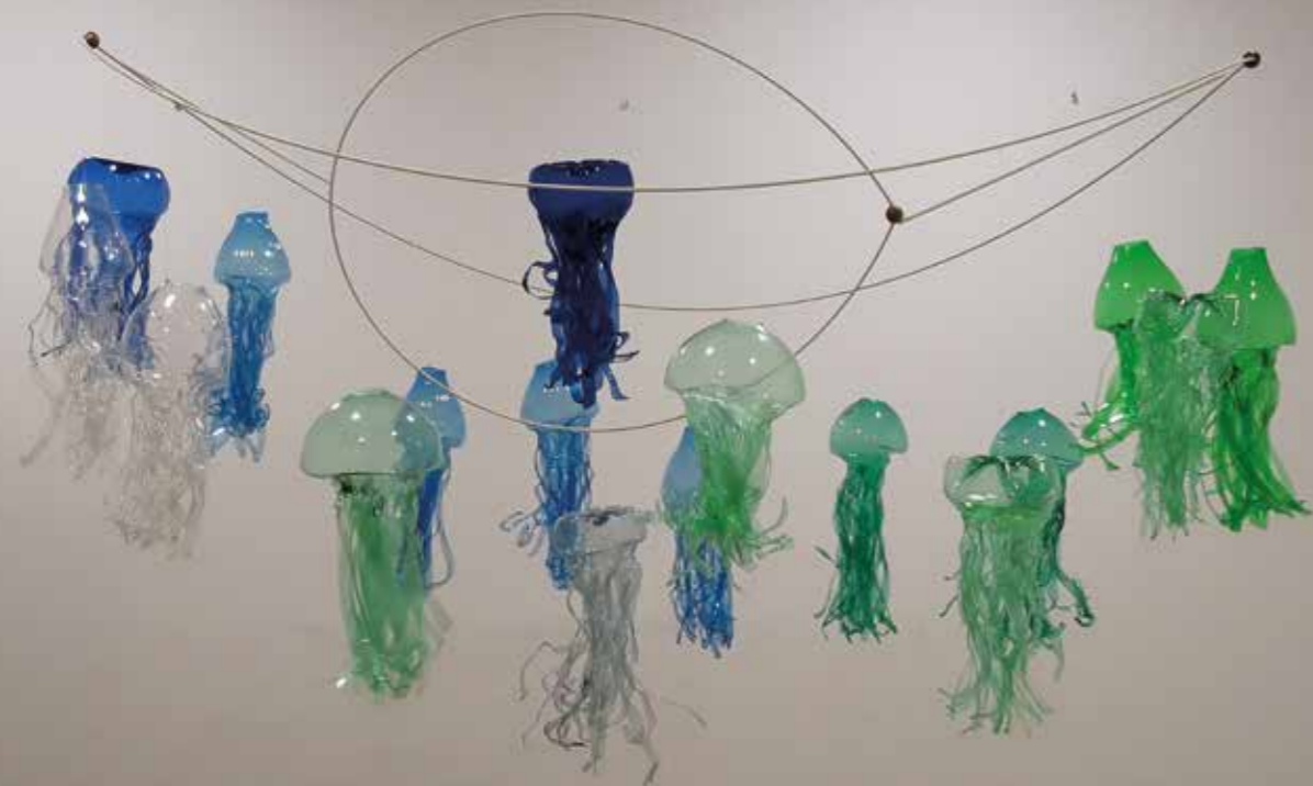
Francesc Ramis Instal·lació ECOERCLE , 2020 Plàstic reciclat 1,5 x 1,5 m