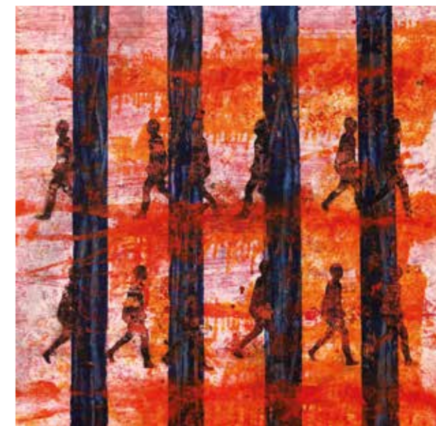
ODS 8 - I, 2020 Tècnica mixta damunt tela 90 x 90 cm