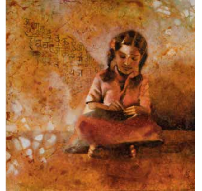
Ales de futur, 2020 Mixta sobre taula 40 x 40 cm