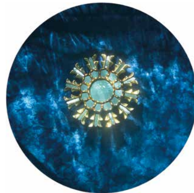
La recerca (La búsqueda) Fotografía digital impresa en Papel Harman by Hahnemühle Matt Cotton Smoth 300 gr. 100 % cotton con tinta Epson Ultra Chrome K3 ink. 60 x 60 cm