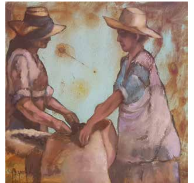
Recolección y exportación de la algarroba colaboración, 2020 Òxids i oli 40 X 40 cm