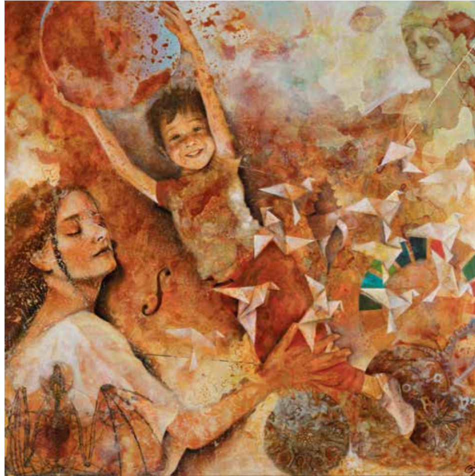
ODS IV, 2020 Mixta sobre taula 100x100 cm