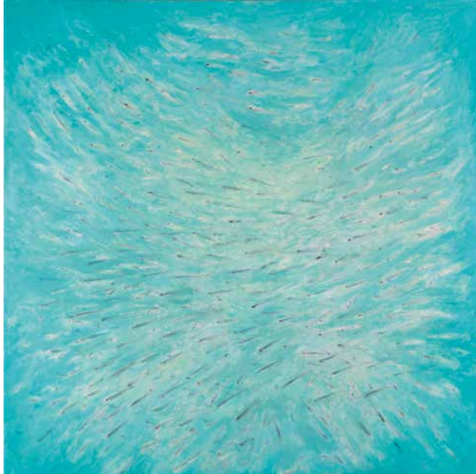
Biogènesi marina Acrílic damunt fusta 100 x 100 cm