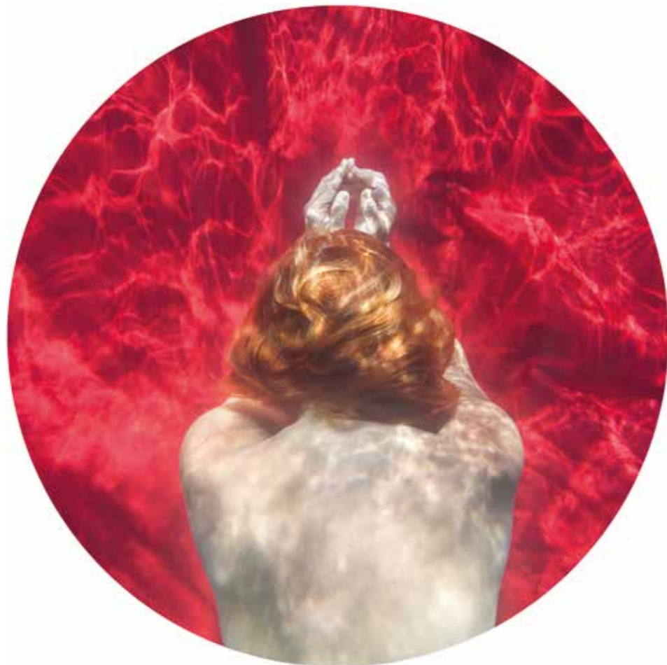
La recerca (La búsqueda) Fotografía digital impresa en Papel Harman by Hahnemühle Matt Cotton Smoth 300 gr. 100 % cotton con tinta Epson Ultra Chrome K3 ink. 60 x 60 cm