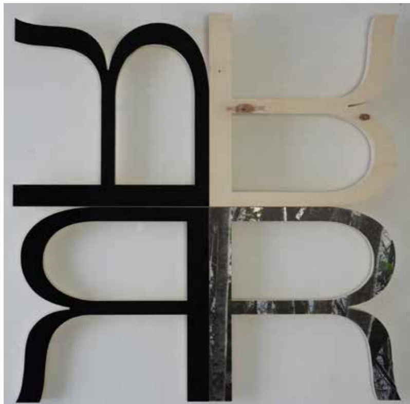
Infraestructres resilientes 100 x 100 cm Fusta, metacrilat i fotografia impresa sobre metacrilat