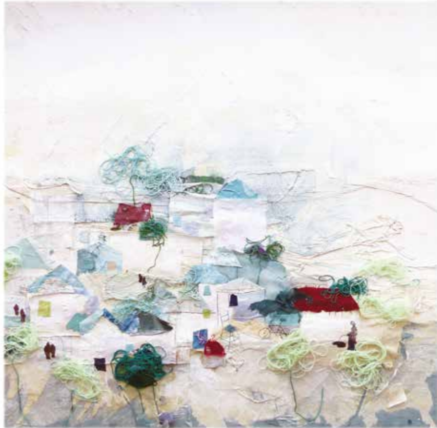
Assentaments humans inclusius, segurs, resilents i sostenibles, 2020 Tècnica mixta 100 X 100 cm