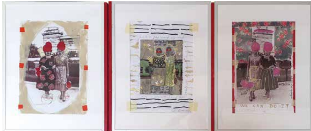
We can do it (triptic), 2019-2020 Mixta-collage sobre impressió digital 41,5 x 100 cm