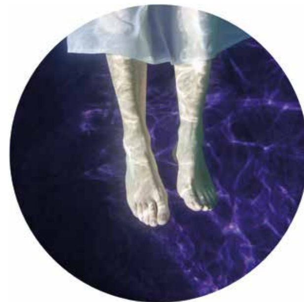
La recerca (La búsqueda) Fotografía digital impresa en Papel Harman by Hahnemühle Matt Cotton Smoth 300 gr. 100 % cotton con tinta Epson Ultra Chrome K3 ink. 60 x 60 cm