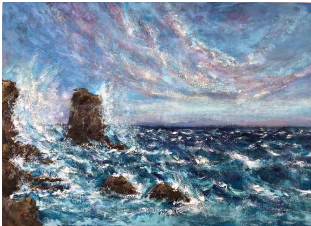
La força de les ones del mar Acrílic i pols de marbre sobre fusta 59 x 81,5 cm