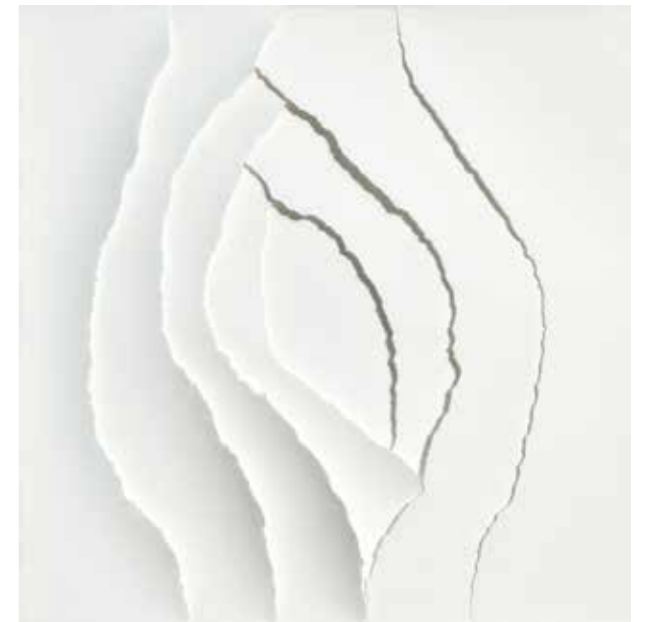
Obra 2, 2020 Paper sobre paper, llum i ombra 40 x 40 cm