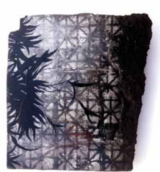
Serie medio ambiente ramas Mixta sobre fusta reciclada 38 X 38 cm