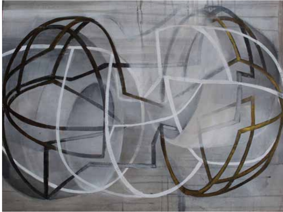
Hidráulica Acrílic sobre tela encolat a taula 54 x 73 cm