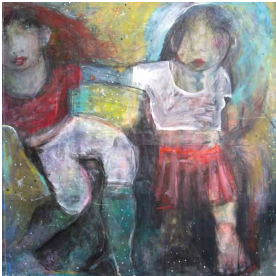
Tan prop, tan lluny, reduïnt diferències Acrílic sobre tela 100 x 100 cm