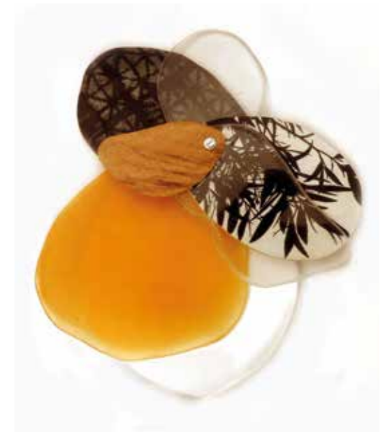
Serie medio ambiente mixta circular Sobre fusta reciclada, metacrilat i alumin 40 X 40 cm