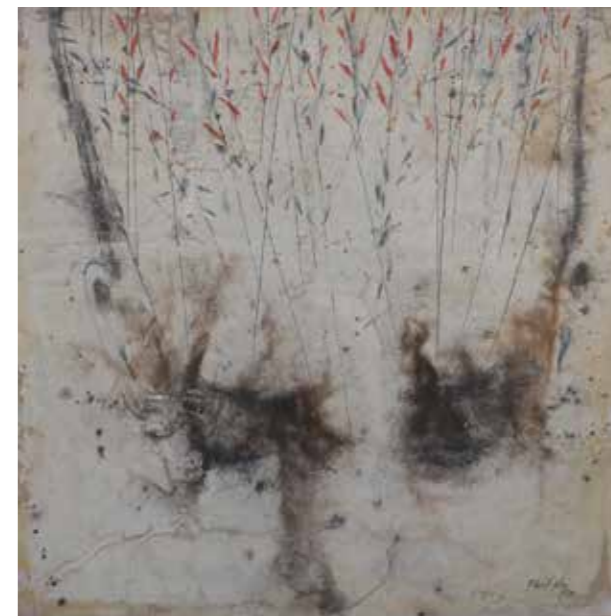
Per la seguretat alimentària, 2020 Acrílic i grafit sobre paper japonès muntat sobre fusta 40 x 40 cm