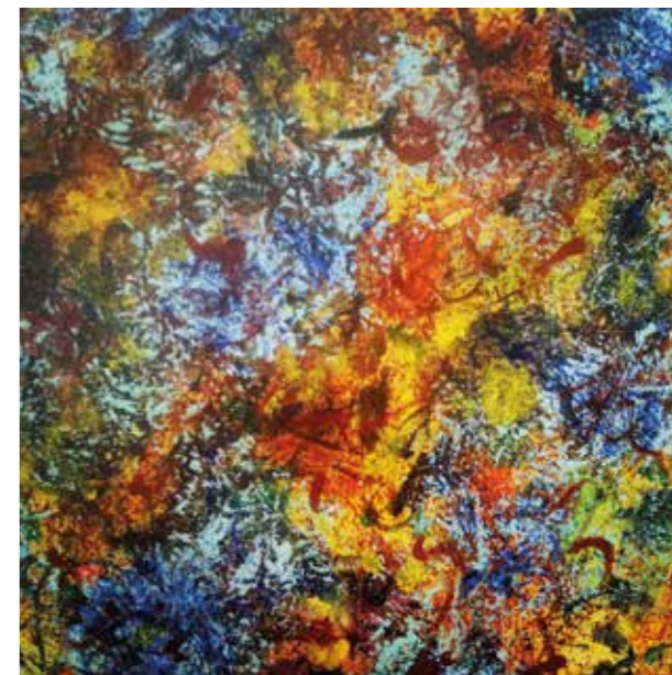
Eaux usees 1 Acrílic sobre tela 40 x 40 cm