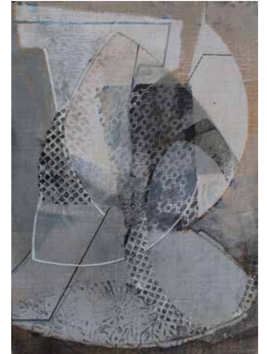
Agua Tècnica mixta sobre taula 35 x 24 cm