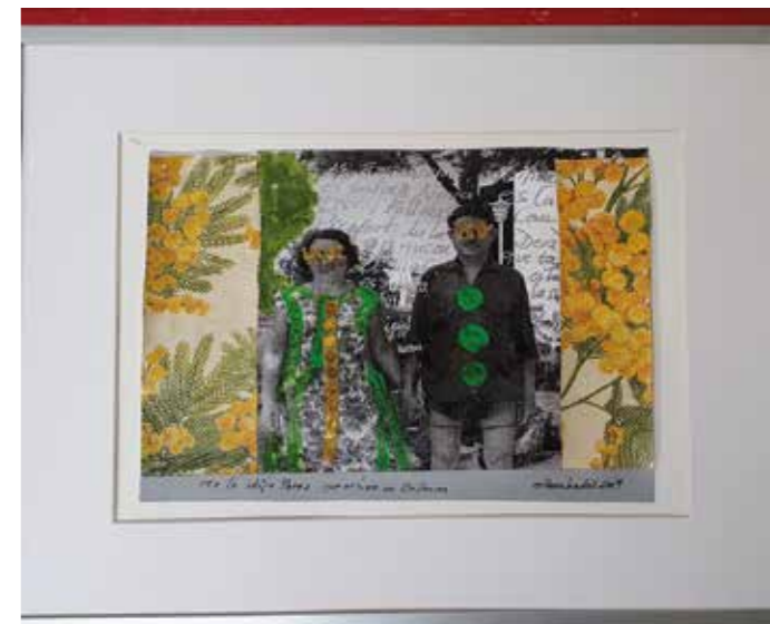
Los Pérez 1 (me lo dijo Pérez), 2019 Mixta-collage sobre paper 32 x 41,5 cm