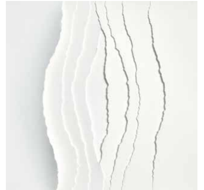
Obra 3, 2020 Paper sobre paper, llum i ombra 40 x 40 cm