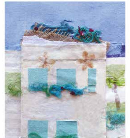
Horts urbans, 2020 Tècnica mixta 100 X 100 cm