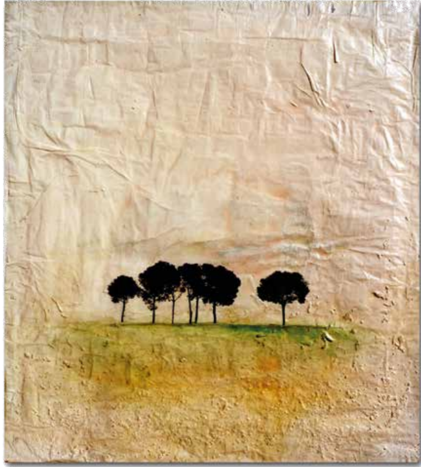
Serie medio ambiente bosque Mixta sobre paper reciclat i bastido reciclatge 103 X 91 cm