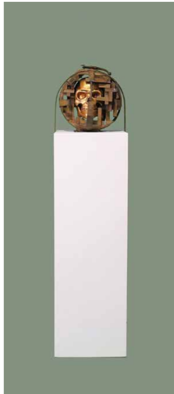
Acción por el clima, 2020 Ferro, fusta de Noguera, pa d'or Escultura 30 cm diàmetre, la pena 1'10 x 35 x 35 cm