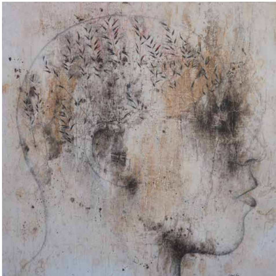
Per la millora de la nutrició, 2020 Acrílic i grafit sobre paper japonès muntat sobre tela 100 x 100 cm