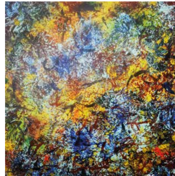
Eaux usees 2 Acrílic sobre tela 40 x 40 cm