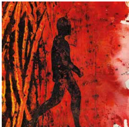
ODS 8 - III, 2020 Tècnica mixta damunt tela 42 x 42 cm