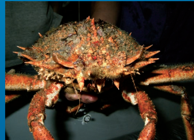
Exemplar adult de Maja squinado al Laboratori