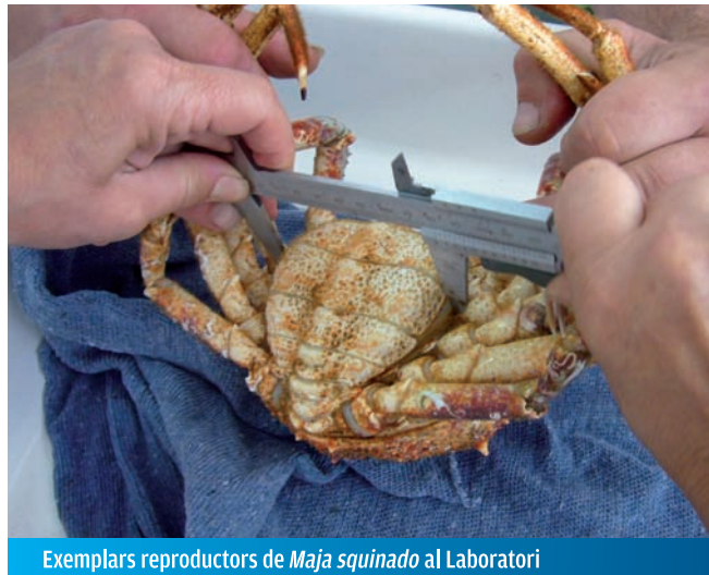
Exemplars reproductors de Maja squinado al Laboratori

Ens agradaria que totes les Cranques avistades o capturades a les Balears, siguin els nous reproductors del Laboratori. Per això, la teva col·laboració és fonamental per a aconseguir que a les nostres aigües torni a viure la Cranca Mediterrània "autòctona".