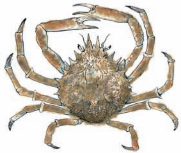
Maja squinado . Format adult 20 cm

Aquesta col·laboració també ens ajudarà a saber amb més certesa la població real de la Cranca a les Illes Balears.