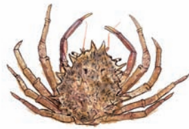
Maja crispata . Format adult 5 cm

Posa't en contacte amb nosaltres: (LIMIA), al 971 672 335 o per correu electrònic a: cranca@dgpesca.caib.es i digà'ns el lloc i data de l'avistament.