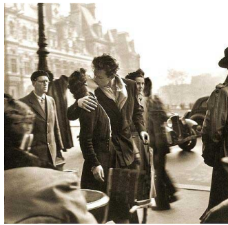
El beso del Hotel de Ville