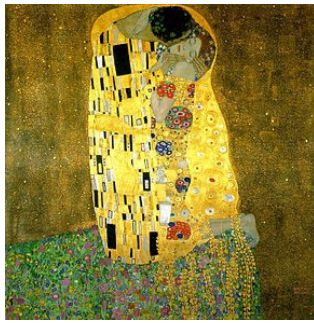
El beso de Gustav Klimt