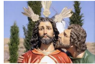
El beso de Judas

"1950. el fotógrafo Robert Doisneau se encontraba en una terraza de un bar con su cámara Rolleiflex. Observaba atentamente a la gente que pasaba por la calle y entre la multitud pudo distinguir a una pareja que, despreocupada de cuanto le rodeaba, avanzaba besándose apasionadamente. Rápidamente, el fotógrafo tomó su cámara de fotos y disparó esta instantánea conocida como El Beso del Hotel de Ville que se hizo famosa hasta convertirse en la foto más vendida de la Historia con 410.000 copias.