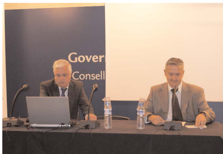
Un dels ponents en el curs amb el director general de Consum.

La Direcció General de Consum i l'Institut Nacional de Consum han organitzat les primeres jornades de publicitat per avançar en l'especialització dels treballadors públics que tenen relació directa amb els usuaris i consumidors