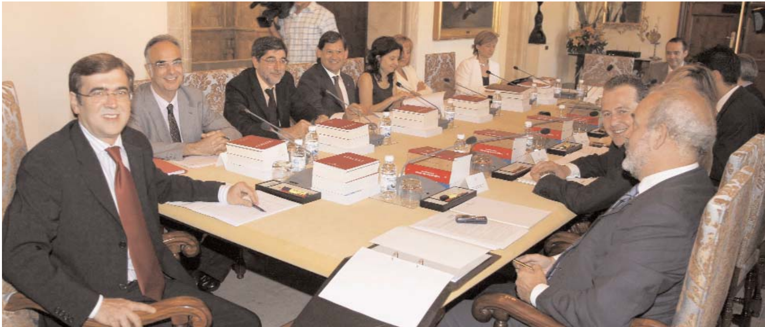
El Consell de Govern de les Illes Balears, que aprovà el decret que regula l'ús dels fulls de reclamacions.

Els fulls de reclamacions també es poden descarregar des de la web www.consum.caib.es