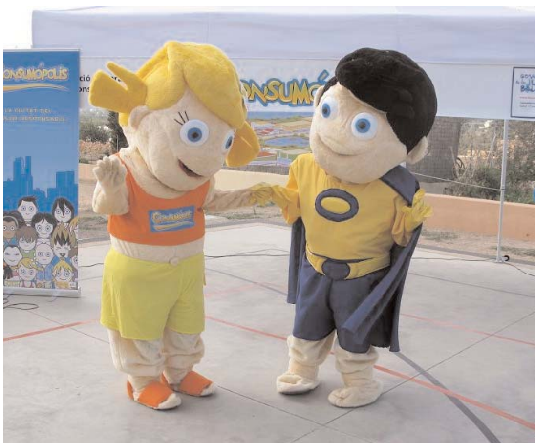
Clara i Just, els dos personatges de Consumòpolis, tornaran a trobar-se aquest curs amb escolars de les Illes Balears.

"I tu de què vas? A mi em va el consum responsable" és el lema d'enguany