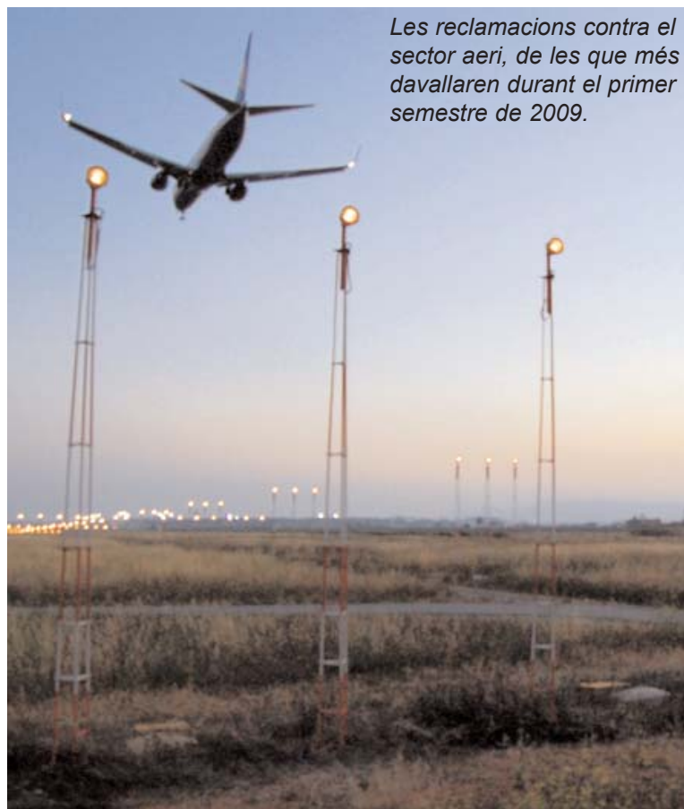
Les reclamacions contra el sector aeri, de les que més davallaren durant el primer semestre de 2009.

Per una altra banda, Consum ha donat resposta a 11.181 consultes, mitjançant les Oficines d'Atenció al Consumidor, el telèfon del consumidor 900 166 000 i els punts telemàtics situats als diferents aeroports i ports i internet de les Illes Balears.