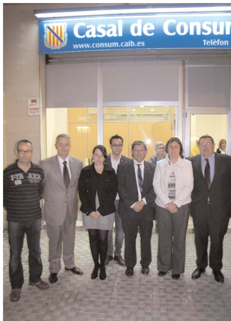
Els assistents a la inauguració del Casal de Consum de Palma.

Aquest nou centre, obert a tots els consumidors de la comunitat, ha suposat una inversió de 48.000 euros