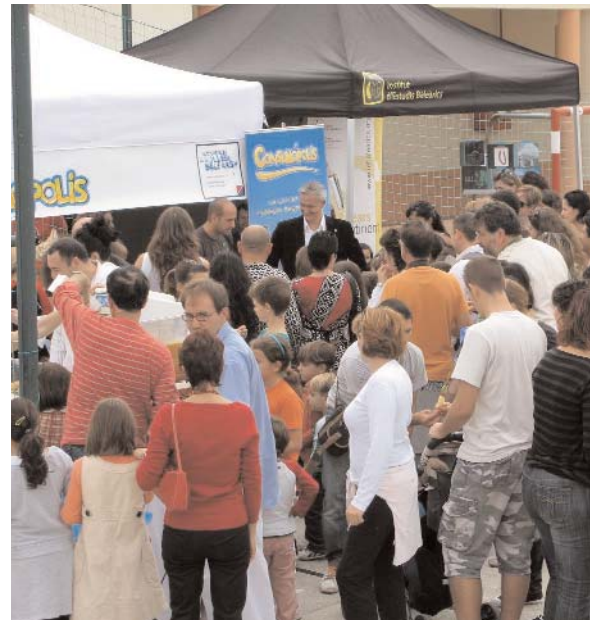
Multitudinària assistència de públic al punt d'informació de la DGC a la fira de Lluçmajor.

més joves, es va servir un berenar saludable a tots els assistents.