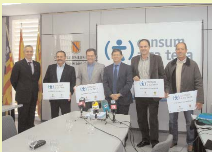
Els batles de quatre municipis eivissencs i el conseller de Salut i Consum, durant l'acte de signatura del conveni.