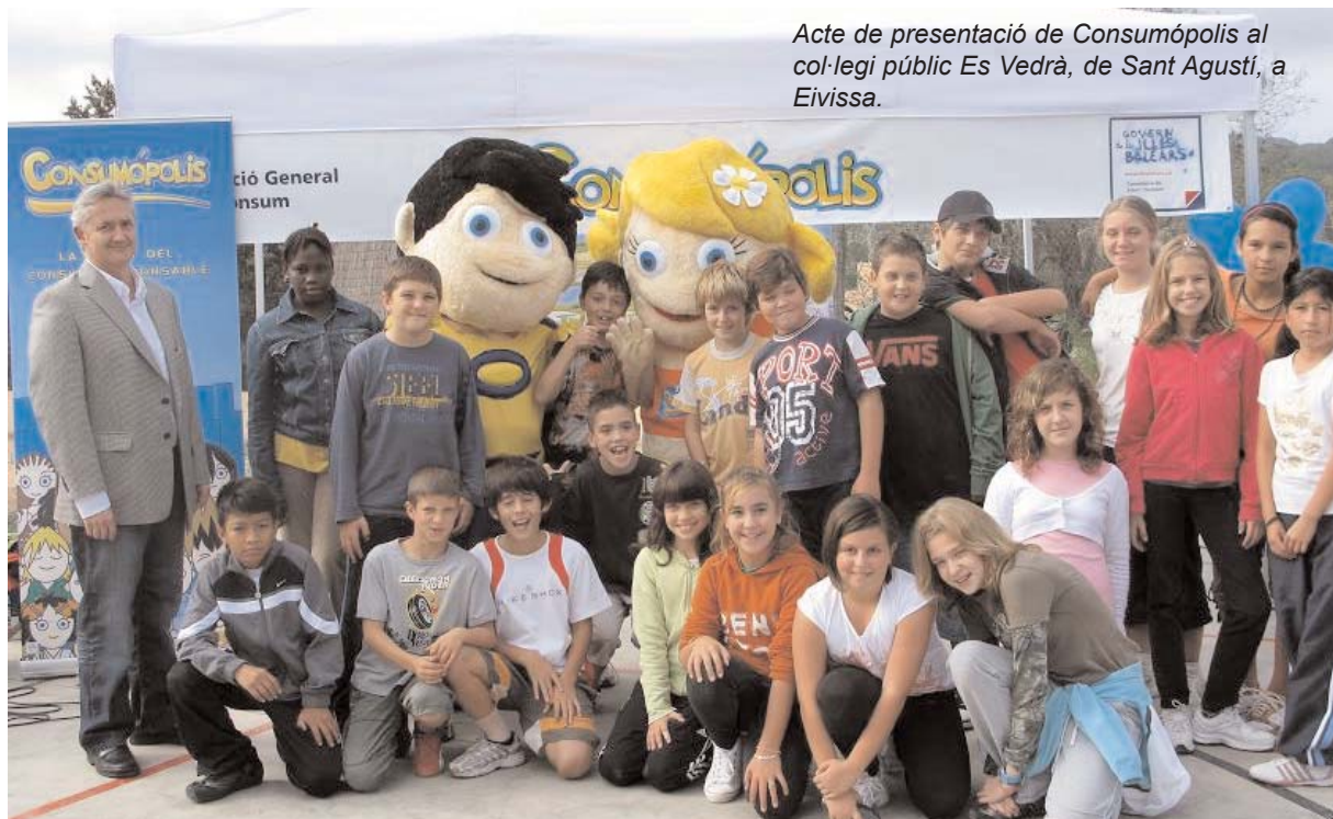
Acte de presentació de Consumópolis al col·legi públic Es Vedrà, de Sant Agustí, a Eivissa.