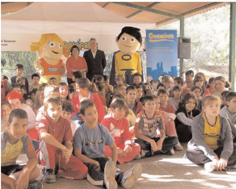
Presentació de Consumópolis davant 69 escolars del col·legi públic Mestre Lluís Andreu, de Sant Francesc Xavier.