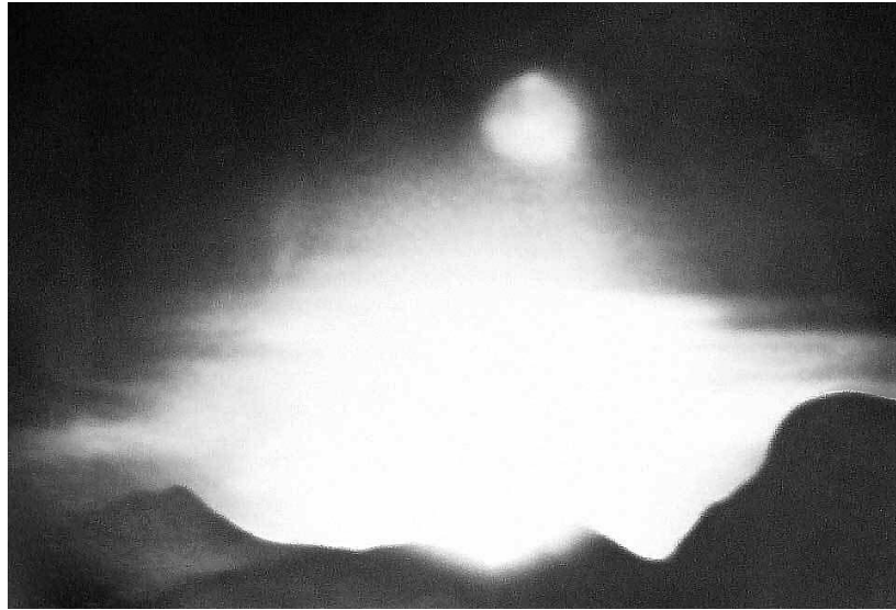
Imatge captada per Pep Climent d'un suposat ovni (12 de novembre de 1979)

A finals dels setanta, la serra de Tramuntana es convertí en el principal lloc d'albirament de suposats plats voladors