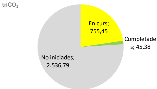
Figura 3. Representació percentual de l'estalvi d'emissions segons l'estat d'execució de les accions. On, eC: Accions del PAESC inicial en curs; eCn: Accions noves en curs; C: Accions del PAESC inicial completades; Cn: Accions noves completades; nI: Accions del PAESC inicial no iniciades; nIn: Accions noves no iniciades