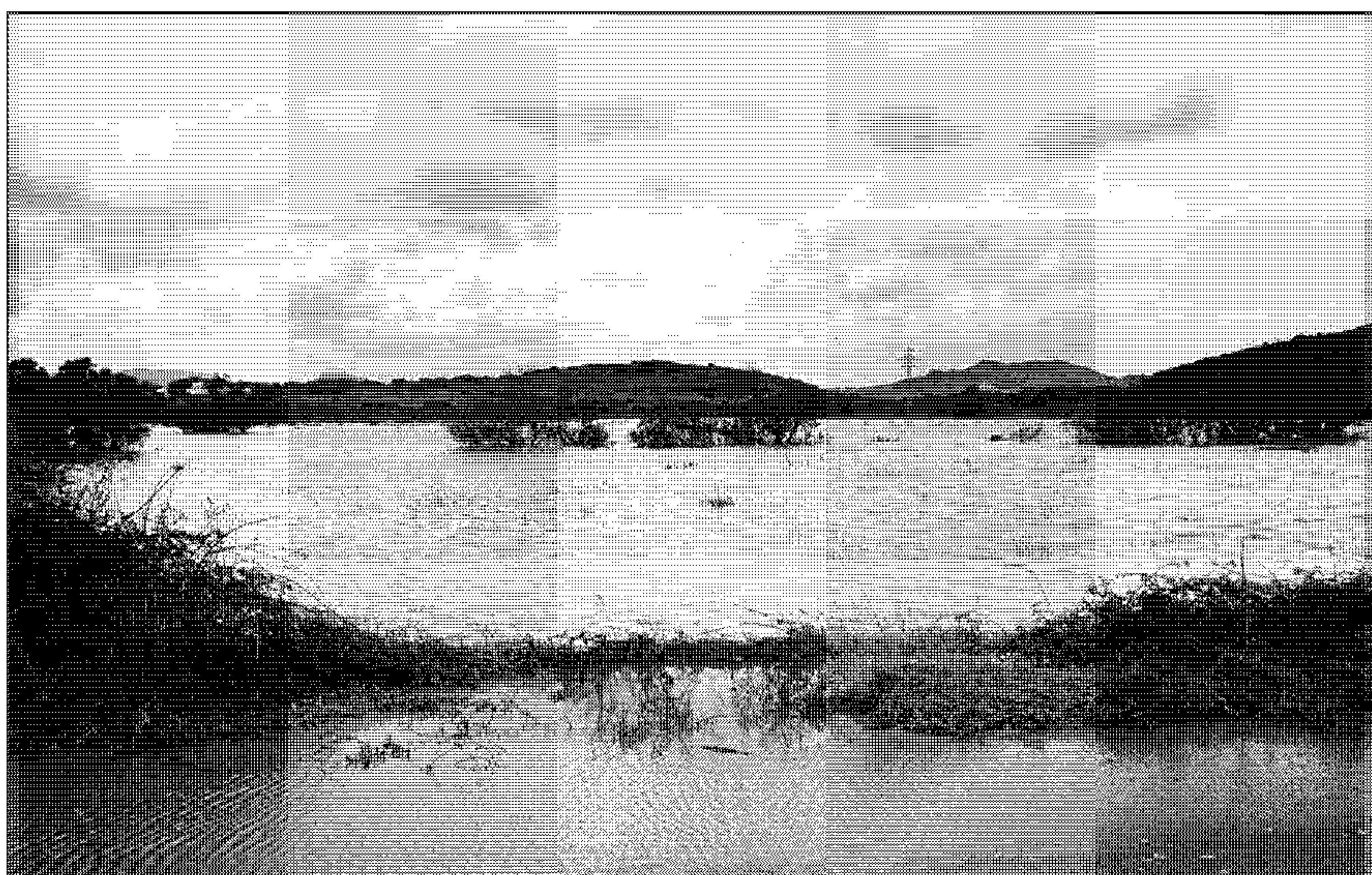
Ses Basses de Luriac, en el término municipal de Es Mercadal, es uno de los acuíferos de Menorca.

Cabe tener presente que el Plan Hidrológico marcará las ac-