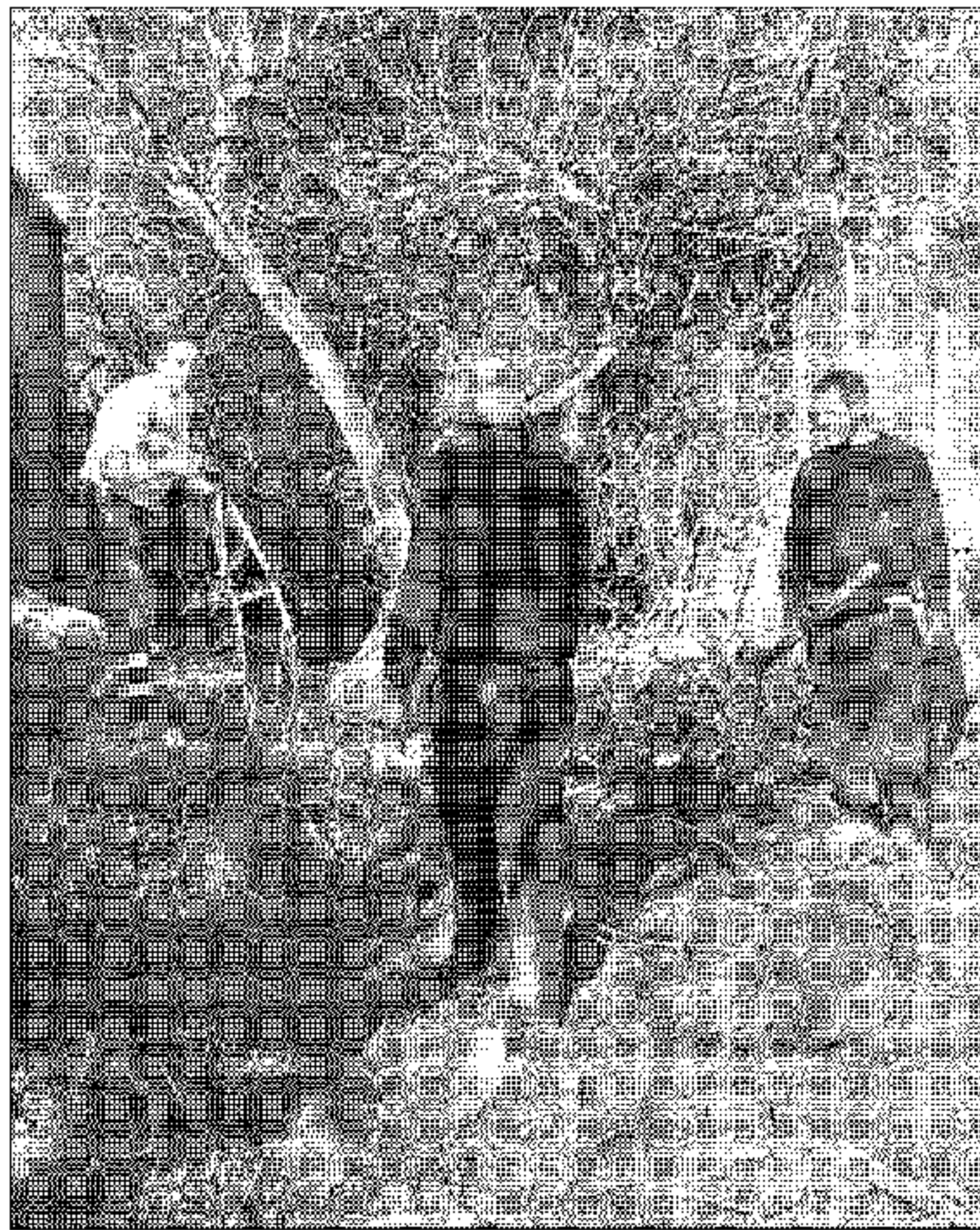
Operarios del Consistorio limpiando el cauce.