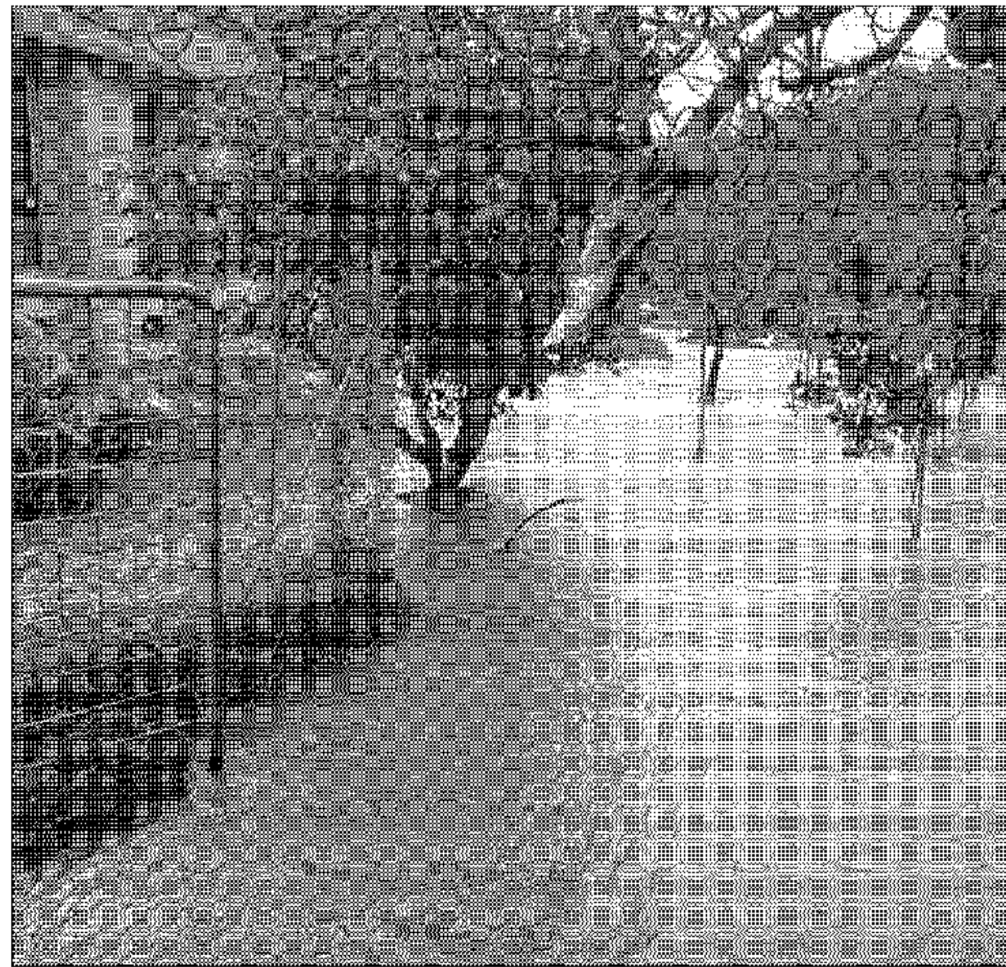
Las casas sufrieron graves inundaciones.