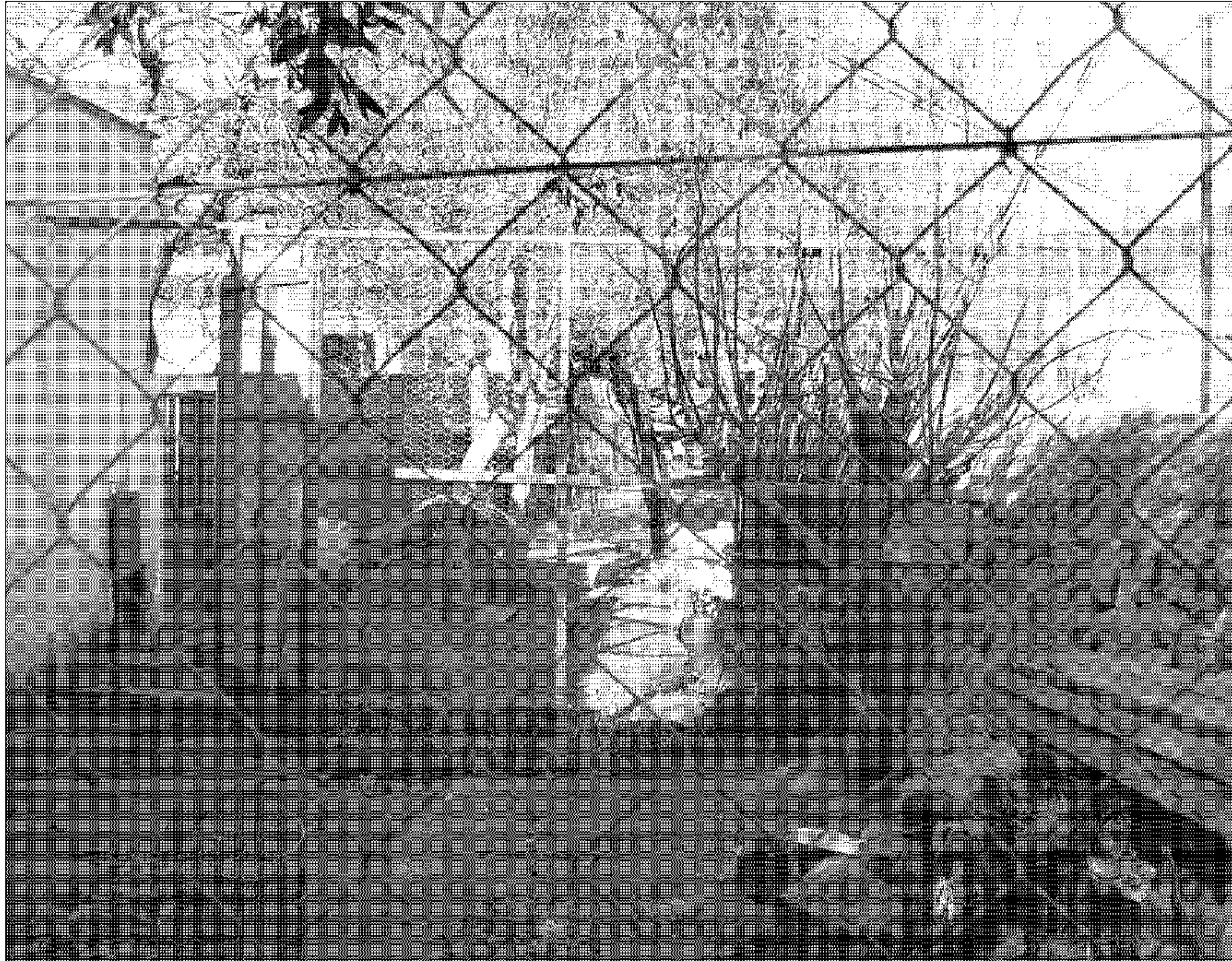
Imagen de un corral levantado sobre el lecho del torrente.

Los hechos han sido denunciados ante la conselleria de Medio Ambiente y el propio ayuntamiento valldemossí. Desde la administración local se desplazaron varios policías para analizar la situación aunque, según dijo, "de momento no han hecho nada al respecto". "Úni-