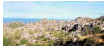
Paisatge càrstic dominat per carritxar. (Gràcia Salas)

Textos i fotografies: Conselleria de Medi Ambient i Mobilitat