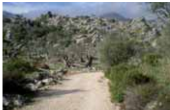
De camí cap a ses Basses enmig de l'oliverar (Gràcia Salas)

Aquests oliverars formen una part inestimable del paisatge de la Serra, que no s'ha d'abandonar. Per això, com podem veure, s'han començat a recuperar.