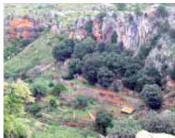
S'Hort des Moli (Gràcia Salas)

Si allargam la vista, a mà dreta ens queda s'Hort des Moli. Tot i el topònim des Moli , no hi ha vestigis de cap enginy hidràulic d'aquest tipus. Probablement hi hagué un molí d'aigua, desaparegut fa molt de temps. Aquí s'hi troba una varietat de cirerer anomenada de saró, molt més petita que la típica mallorquina i bastant més tardana. En menjar aquesta casta de cirera, el pinyol queda ben net. A la primavera és tot un espectacle veure els cirerers florits.