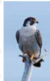
Falcó (Gràcia Salas)

Durant la tardor, la caça d'un falcó en un esbart d'estornells és espectacular; els aucells s'agrupen en una gran massa atapeïda que es mou en el cel. El falcó ataca l'esbart així com pot, i aquest fa un forat i deixa passar el rapinyaire de llis... Això es repeteix una vegada i una altra, fins que el falcó es cansa o un malaurat estornell se separa del grup protector. Aleshores està fet d'ell.