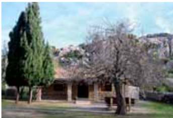
Refugi de Lavanor (Gràcia Salas)

Retornem al camí i passam pel costat d'un poll ( Populus nigra ) molt gros, amb una soca impressionant, a prop de la font Blanca. Antigament, els polls se sembraven al costat d'una font perquè des de lluny es pogués veure que hi havia un lloc on refrescar-se.