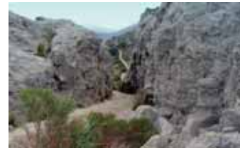
Coll des Vent (Gràcia Salas)