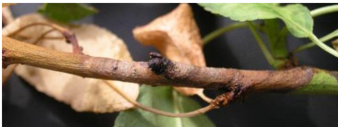
Xancre en brot d'ametller causat per Phomopsis amygdali

Els arbres són molt sensibles a l'atac d'aquests dos fongs des de l'estadi fenològic B fins a l'estadi F. Per tant, durant aquest període és recomanable mantenir protegides les plantacions afectades. Les substàncies actives recomanades són mancozeb, maneb, metiram i oxíclorur de coure.