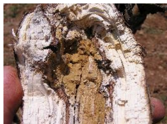
Cep afectat per Esca