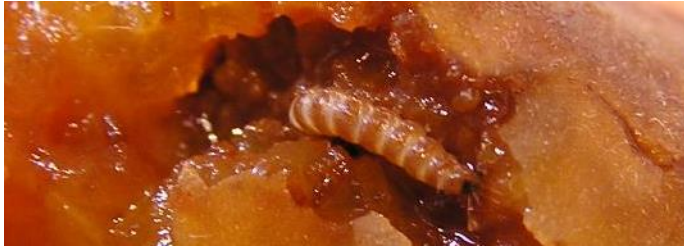
Eruga d'anarsia en albercoc.

És recomanable tractar les finques amb antecedents d'atacs d'anàrsia abans de l'estadi fenològic E amb oli d'estiu i un insecticida. Això ajudarà a rebaixar el nivell de larves hivernants abans de la floració. A més, aquest tractament té efectes sobre el poll de Sant Josep i l'aranya bruna.