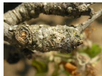
Poll de Sant Josep a pomera.