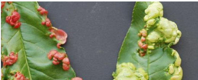
Fulles d'ametller afectades per Taphrina deformans

El més indicat per controlar aquesta malaltia molt freqüent al melicotoner i ametller és un tractament preventiu. Es recomana aplicar-lo durant l'estadi fenològic B-C. Després només cal tornar a aplicar el tractament si plou o si hi ha humitats relatives elevades. Els productes més eficaços són els composts de coure, tiram, captan i folpet.