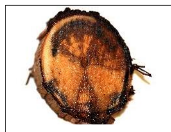
Talls transversals de vinyes on es pot observar en sarment punts necròtics (esquerra) i en braç (necrosi sectorial) dreta

Però no tant sols és a les vinyes on es troben aquestes malalties. Recentment s'ha comprovat a diverses zones del món, incloent Mallorca, la presència d'alguns d'aquests fongs a altres cultius llenyosos com els fruiters, l'olivera o l'ametller, associats a símptomes de clorosi de fulles, assecament de branques i decaïment generalitzat. Els símptomes interns, a la fusta, inclouen necrosis sectorials (en cunya), punts necròtics, necrosis irregulars, descomposició dels teixits (esponjament), etc., que es poden observar, en cas d'afecció, als talls de poda.