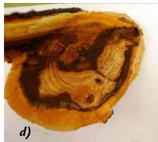
Símptomes en ametllers d'afecció per malalties fúngiques de la fusta, a) y b) necrosis sectorials, c) punts necròtics, d) descomposició dels teixits