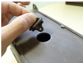
Retirau el tap de la carcassa.