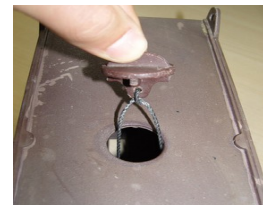
Col·loqueu el tap dins la carcassa.