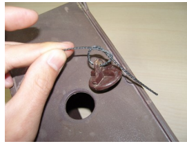
Feu un nus al cordó.