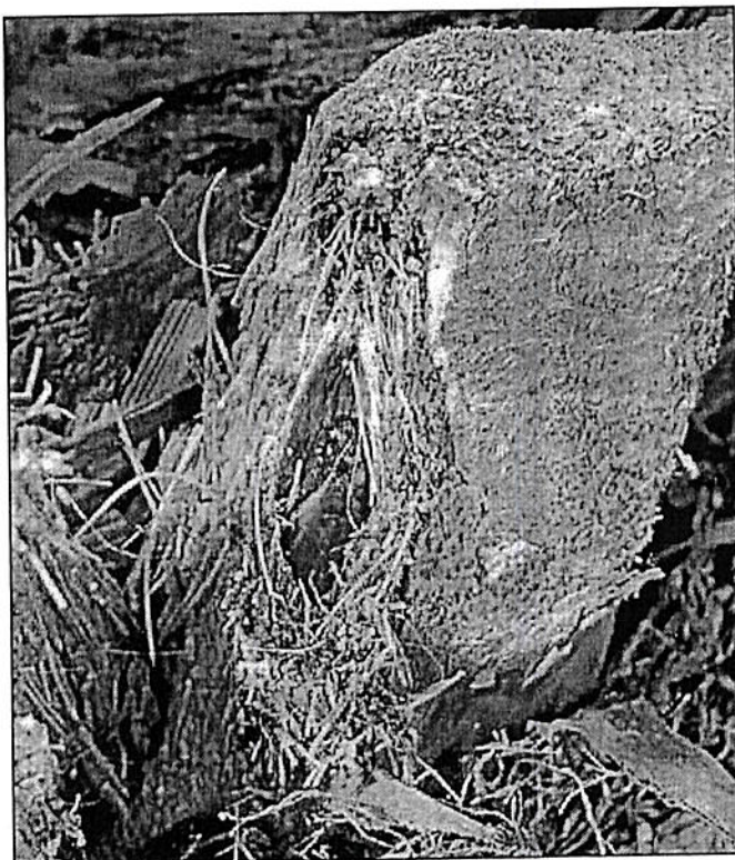
La oruga ataca al tronco de las palmeras y puede matar el árbol.

Actualmente, Pollença es una zona muy afectada y también se ha descubierto un nuevo foco en Andratx. Así lo explicó a este periódico la directora general