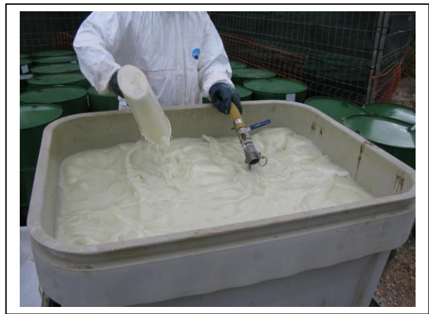
19.16 Fase 4 de dissolució a oli