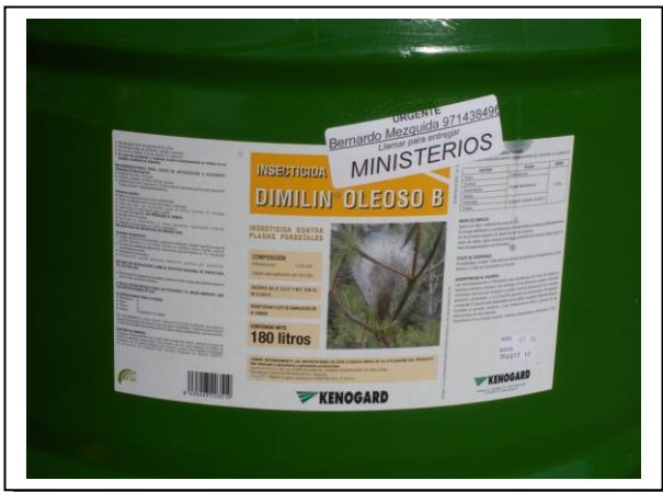
19.7 Bidó metàlic de 200 litres amb oli i diflubenzuró