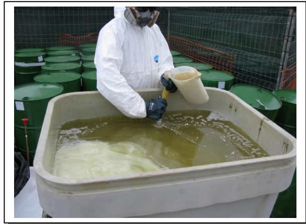
19.14 Fase 2 de dissolució a oli