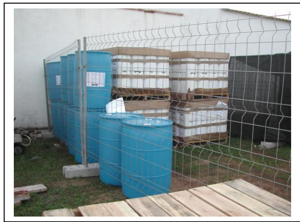
19.8 Bidons de 180 i 20 litres de Bacillus