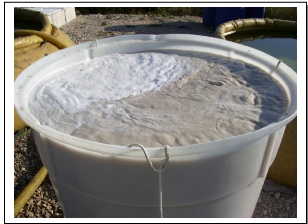
19.20 Fase 4 de dissolució aigua