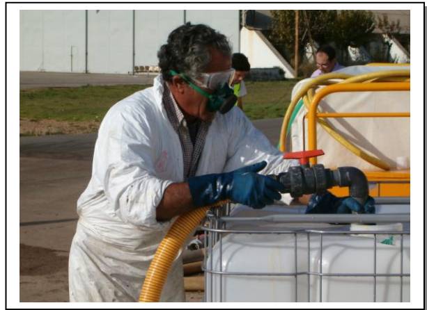
19.4 Càrrega del producte