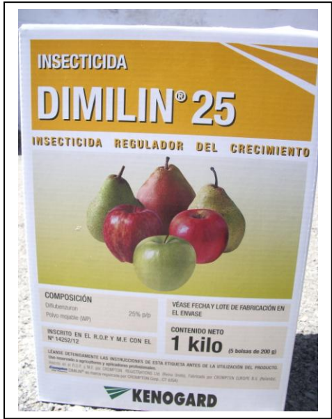
19.9 Diflubenzuró pols mullable