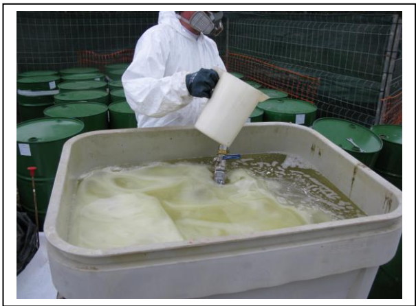
19.15 Fase 3 de dissolució a oli