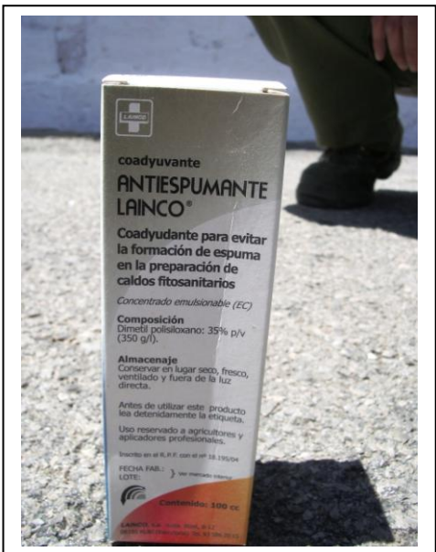
19.11 Antiescumant per a mescla de pols mullable amb aigua