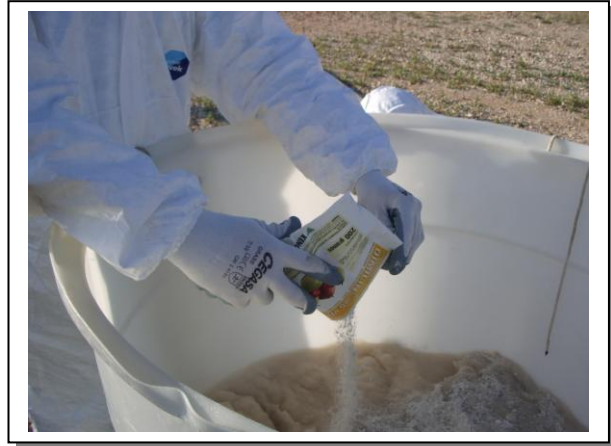
19.18 Fase 2 de dissolució aigua