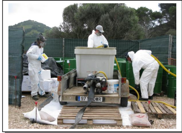
19.22 Operaris amb mescla, Observi les mesures de protecció i prevenció (EPI's, sorra, etc.)