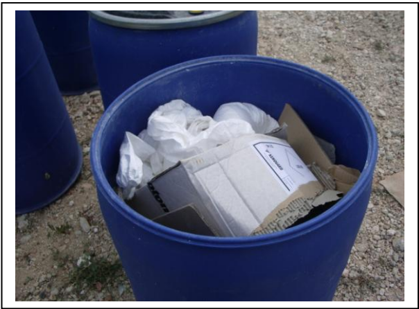
19.23 Recopilació d'envasos