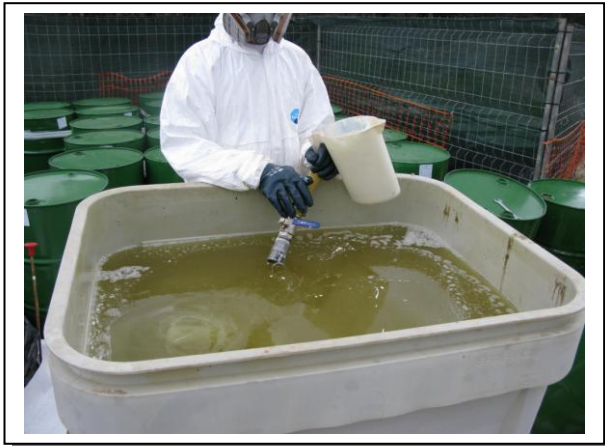
19.13 Fase 1 de dissolució a oli