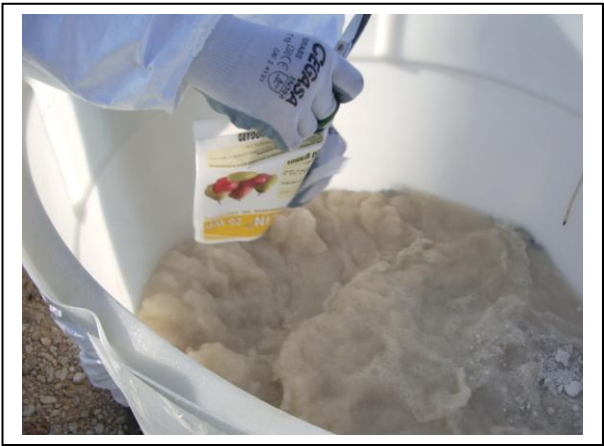
19.19 Fase 3 de dissolució aigua