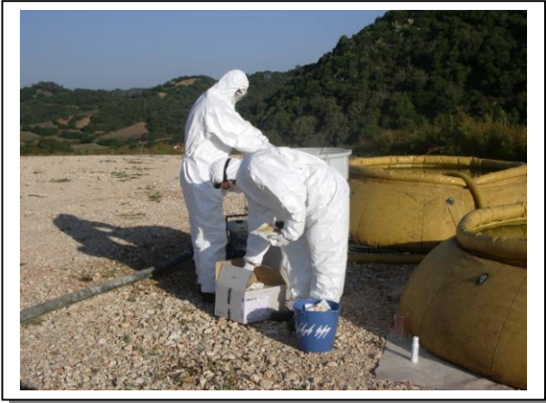
19.21 Preparació del producte