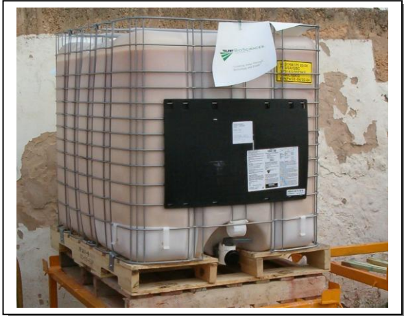
19.5 Envasos de 1000 litres