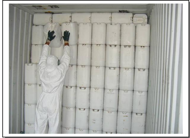
19.2 Descàrrega de bidons