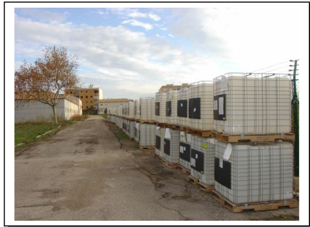
19.24 Bidons buits per entregar a SIGFITO