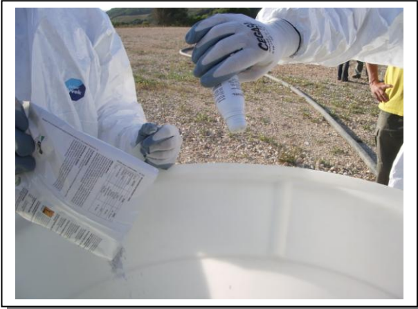
19.17 Fase 1 de dissolució aigua