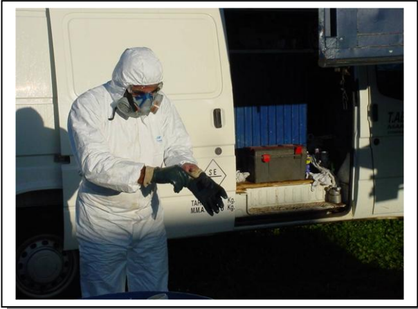
19.1 Operari posant-se el EPI