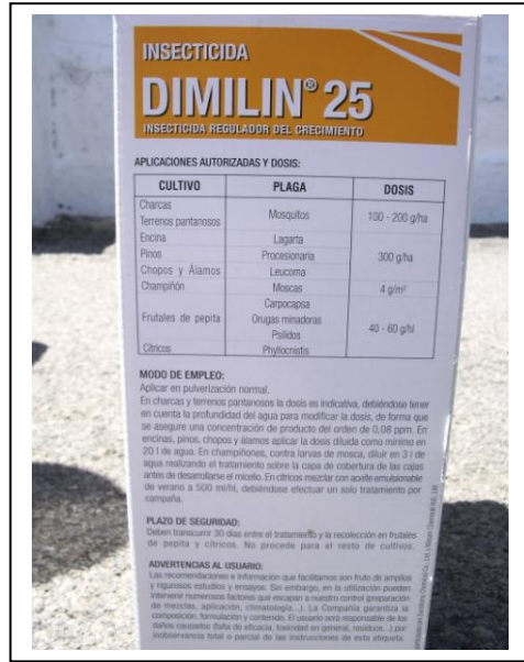
19.10 Dosi d'aplicació de producte per cada plaga i manera de maneig