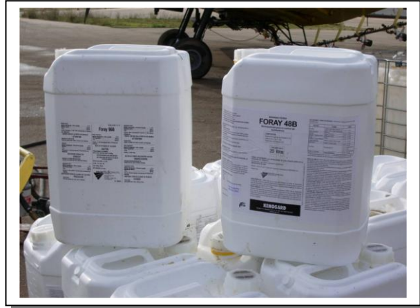
19.6 Envasos de 20 litres de dues formulacions