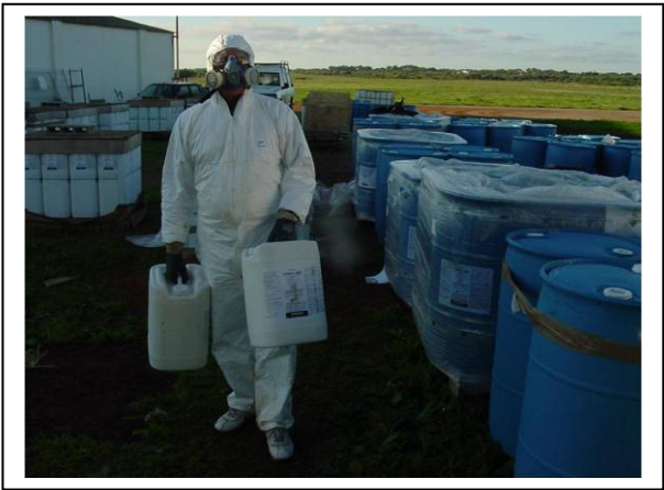
19.3 Manipulació de bidons