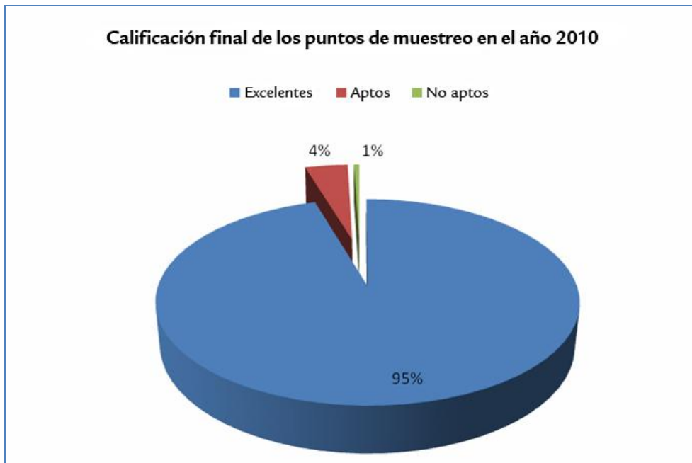
Gráfico 1. Gráfico de la calidad de las aguas de baño en la Islas Baleares (2010).