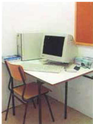
Centralita de control de dades.