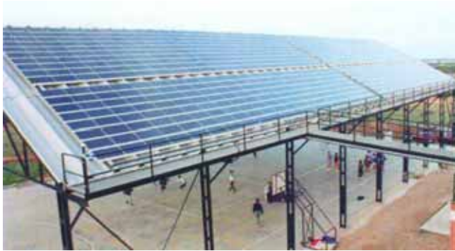
Plaques fotovoltaiques que formen la coberta del poliesportiu.