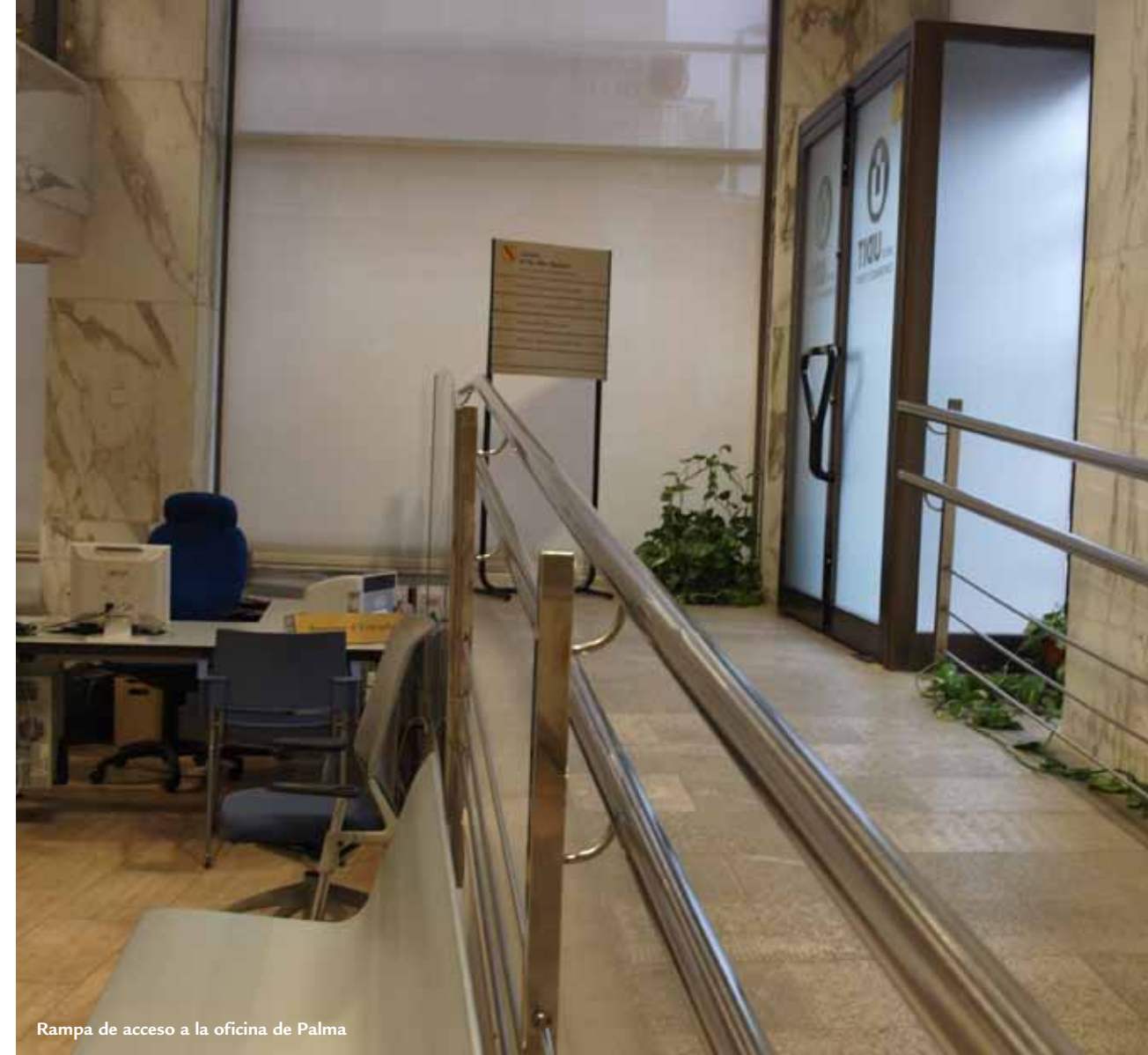
Rampa de acceso a la oficina de Palma